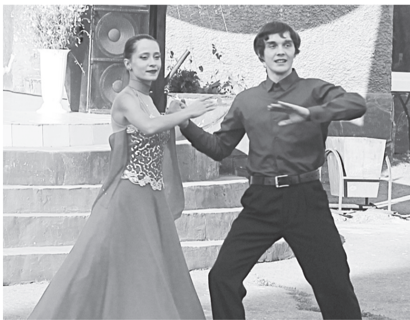
Вальс – выступление «Россияночки»