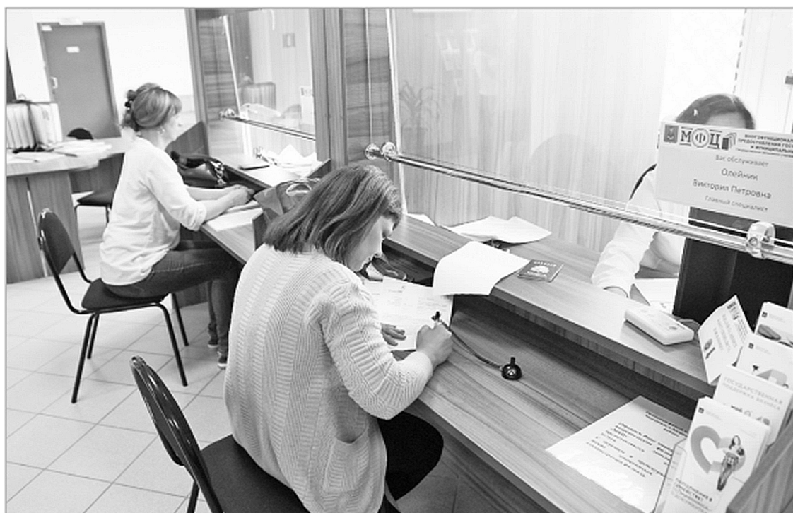
Возможность получить услуги по принципу «одного окна» есть во всех муниципальных районах и городских округах Тверской области

Собственно, показатели по охвату населения услугами, предоставляемыми с помощью МФЦ, достигнуты, и установки, обозначенные в майских указах Президента РФ, в нашем регионе выполнены. На территории Тверской области работает 33 филиала МФЦ и 91 территориально обособленное самостоятельное подразделение, их услуги доступны более чем 90% жителей всех муниципальных образований региона. За два года, если сравнивать 2018-й с 2016-м, количество