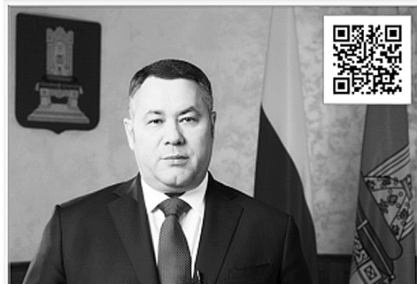
По ссылке в QR-коде – видеообращение губернатора Тверской области

– На прошлой неделе было дано поручение правительству подготовить программу поддержки бизнеса, сделав особый упор на сохранение занятости и доходов людей.