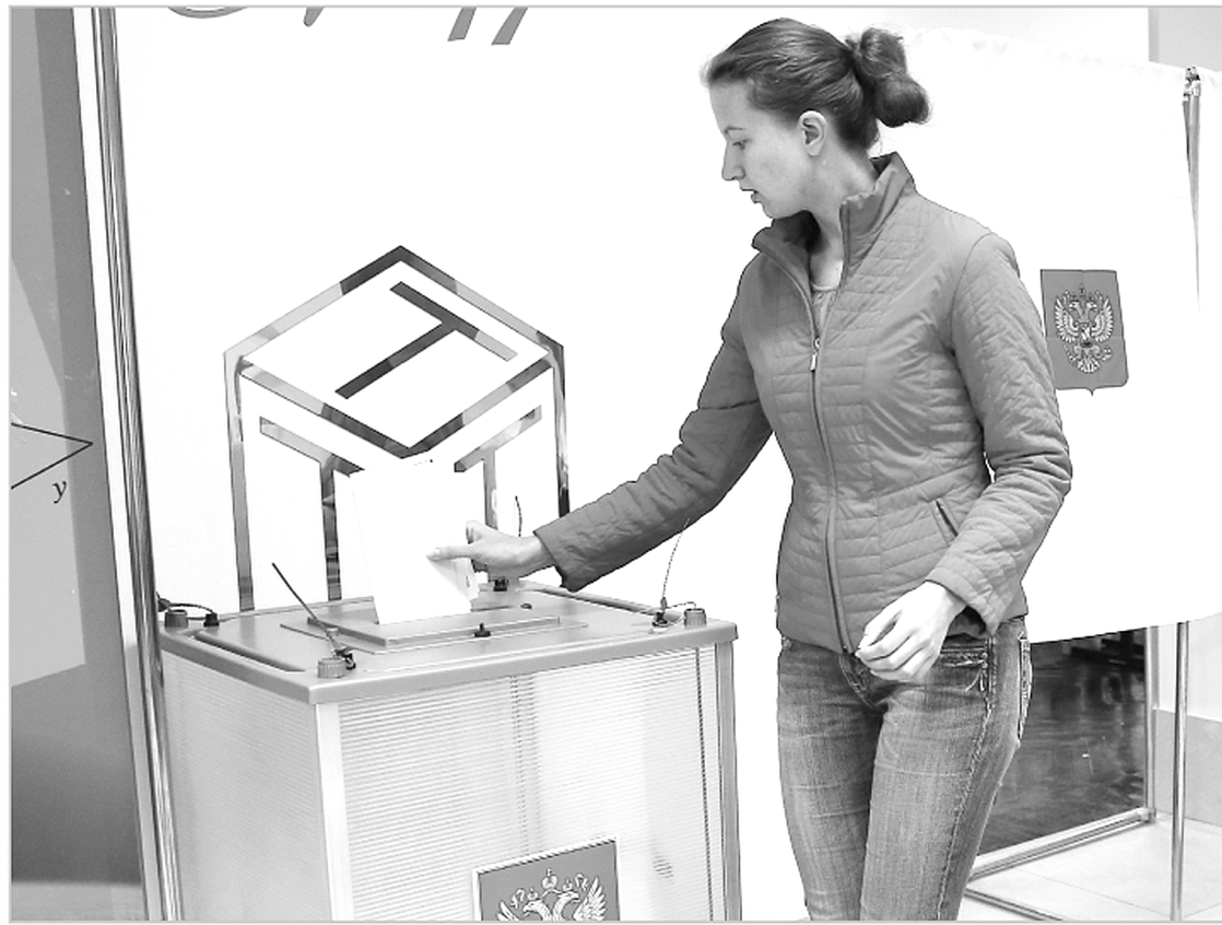
Более 104 тысяч жителей области пришли на избирательные участки в своих муниципальных образованиях

В 14 муниципалитетах электоральная активность превысила 50%. Рекорд установили в Андреапольском районе. Здесь на выборы пришли 80,45% избирателей Хотилицкого сельского поселения, 73% – Аксеновского с/п и 72,6% – Торопацкого с/п. А в 12 избирательных кампаниях явка была ниже 30%. Самыми равнодушными к процессу остались жи-