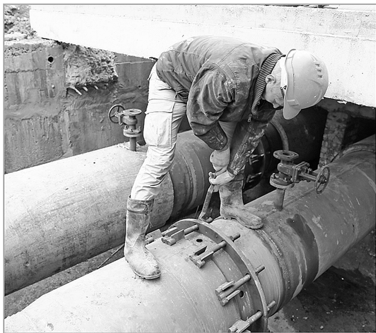
Все ремонтные и регламентные работы на объектах ЖКХ области должны быть выполнены в срок и в полном объеме – персональная ответственность за это возложена на глав районов и руководителей профильных ведомств

На капитальный ремонт и модернизацию объектов ЖКХ планово выделяются средства из областного и муниципальных бюджетов. В прошлом году в районах области капитально отремонтировали 25 объектов ЖКХ и еще 5 модернизировали. В текущем году из регионального бюджета на капремонт объектов теплоснабжения направлено более 75,8 млн рублей и свыше 91,4 млн рублей – на мо-