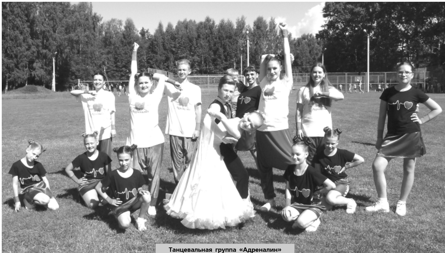
Танцевальная группа «Адреналин»

Спортивные соревнования – это всегда праздник, а любой праздник должен выглядеть запоминающимся и увлекательным.