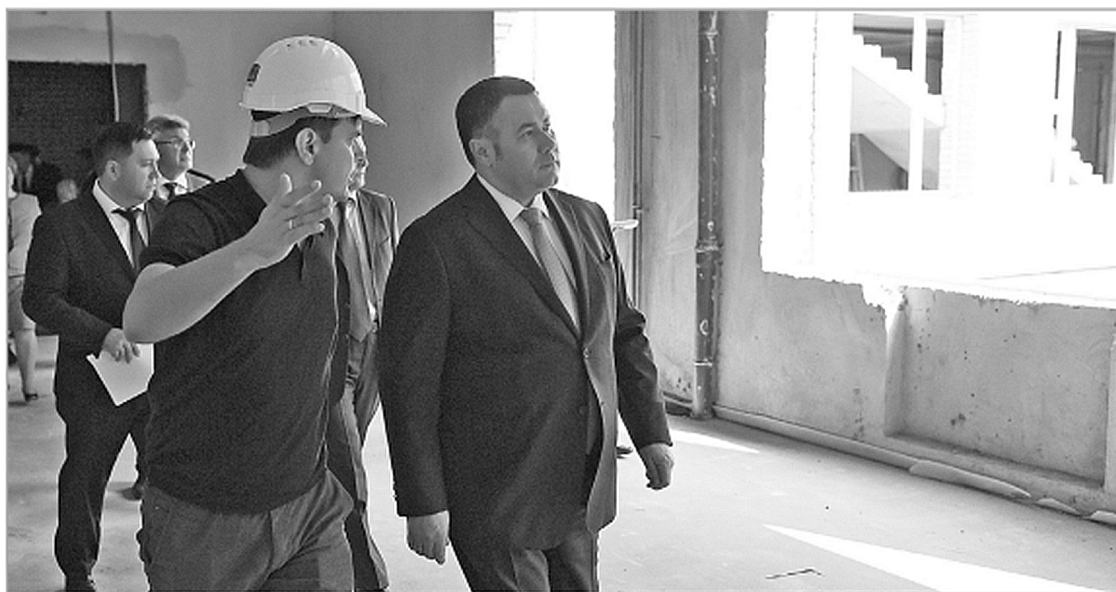
Губернатор Игорь Руденя, инспектируя строящиеся школы и детские сады, требует обеспечить качество работ и сроки сдачи объектов

В программу включено 143 учреждения – их список расширился в начале июня, когда региональное правительство выделило дополнительные средства на финансирование этого направления. С учетом финансовой добавки на проведение ремонтных работ из областной казны выделено почти 292 млн рублей, из федеральной – свыше 7 млн рублей, местные