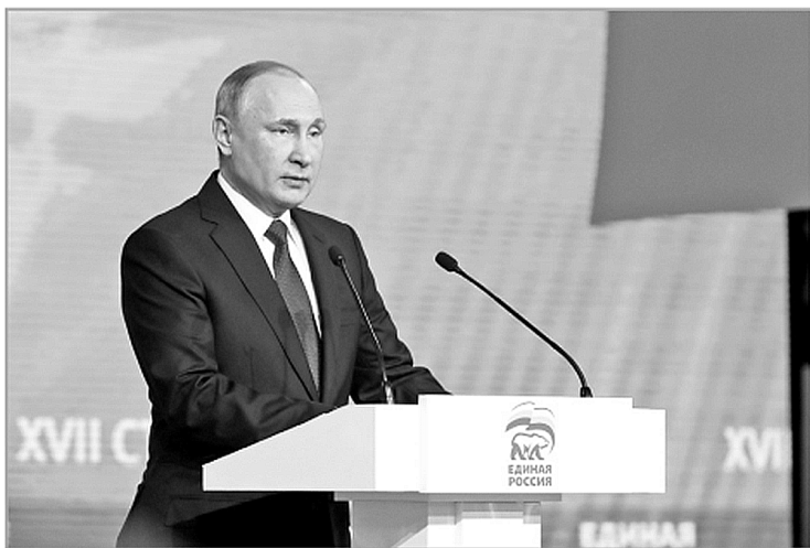
Владимир Путин: «Вся наша работа должна быть нацелена на сбережение нации»

Президент рассказал, в чем он видит главное предназначение Народного фронта: помогать людям, отстаивать правду и справедливость, защищать граждан России. По мнению Владимира Путина, для этого и нужны проекты по общественному контролю в сфере госзакупок, в здравоохранении, образовании, а также в области