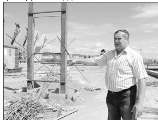
За три года на реконструкцию потратят 105 млн рублей.