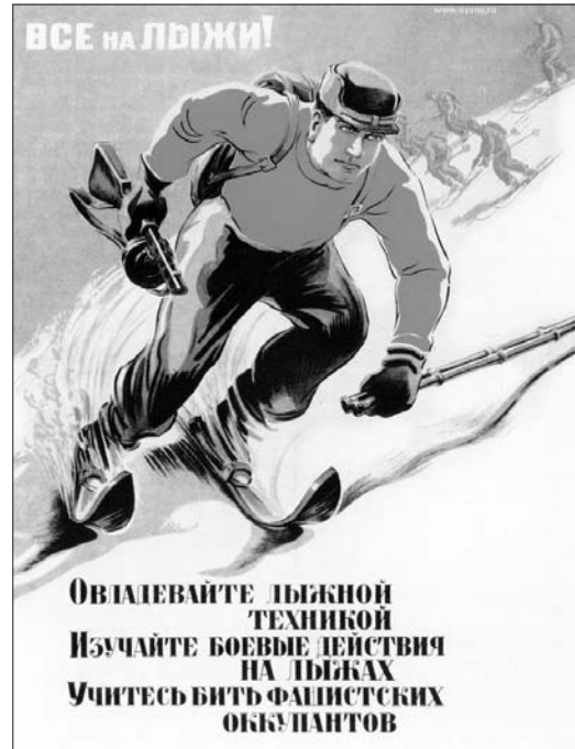
Один из распространенных плакатов военного времени.

Несмотря на положительные тенденции в развитии спорта, отмечался и ряд недостатков в военно-физкультурной работе города, особенно в первый период войны: “Военно-физкультурная работа в городе отстает от требований военного времени. Физкультурные организации города полностью не перестроились на запросы военного времени...”. Неоднократно руководителям спортивных обществ выносились замечания за безответствен-