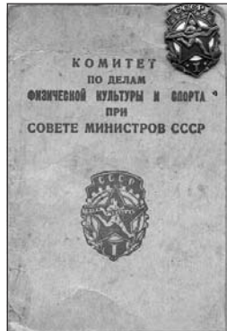
Знак вместе с удостоверением.

гимнастику, шахматы, футбольные матчи, шведскую эстафету, волейбол. Каждое такое мероприятие сопровождалось выступлением коллективов художественной самодельности. Читинцы могли получить консультацию по вопросам физической культуры, для чего на все время мероприятий организовывались специальные столы справок.