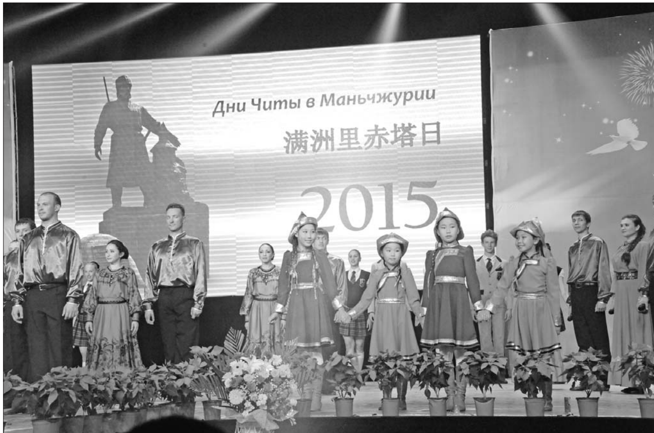
Чита, нихао! Гостей из города-побратима принимали в приграничной Маньчжурии.