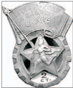
Нагрудный знак “Всегда готов к труду и обороне 2 степени”.

Яркими событиями в жизни города являлись соревнования, посвященные праздничным датам: Всесоюзный день физкультурника, 1 Мая, День Военно-Морского флота. Так, второй День физкультурника в 1944 году проводился под “знаком” смотра физкультурной работы города, боевой работы готовности физкультурников, молодежи и трудящихся к защите Родины... Мероприятия длились в течение нескольких дней и включали прием легкоатлетических норм и норм по гребле на озере Кенон, обучение плаванию физкультурников и трудящихся, прыжки в воду с вышки, рукопашный бой, бокс,