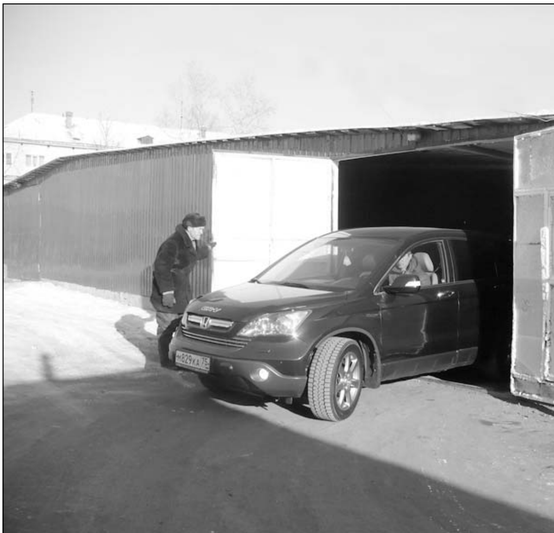
Автостоянка очень востребована жителями посёлка ГРЭС.

В 2013 году, когда подошел очередной срок продления договора, он обратился к чиновникам с очередным заявлением,