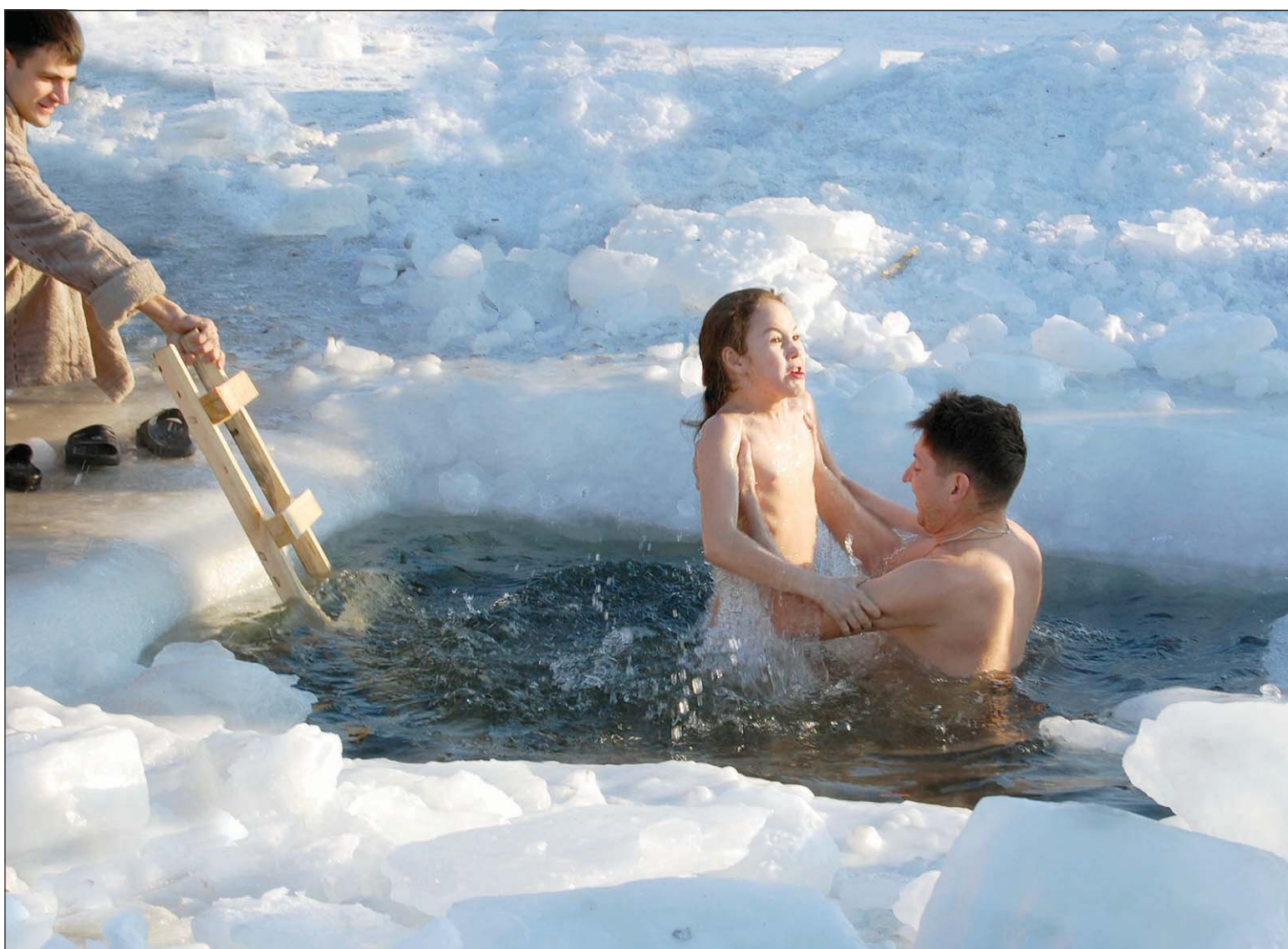
Несмотря на зазорный мороз с вечера 18 января и до 22 часов 19-го тысячи забайкальцев совершали традиционные омовения в честь великого православного праздника — Крещения Господня.