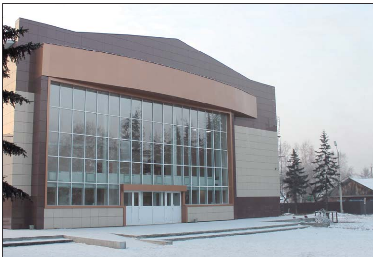
В селе Красный Чикой на месте сгоревшего ДК спустя семь лет после происшествия появился новый очаг культуры.