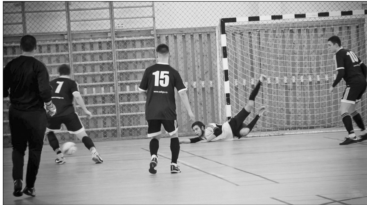
В Забайкалье есть перспективные ребята. Только им нужно помочь в развитии футбольного таланта.