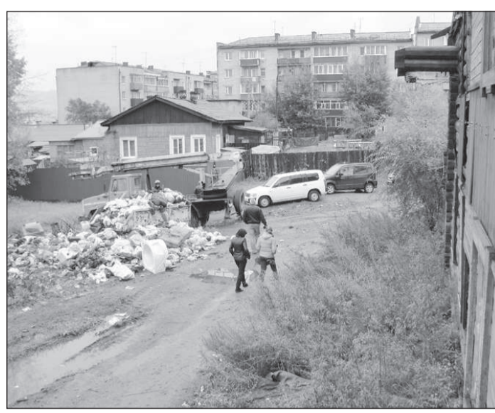
Факты хищения в нашем городе выявляются регулярно.