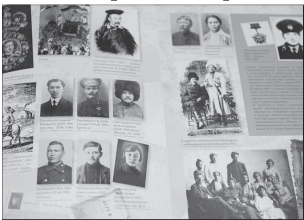
Фотоархивы книги о князьях Гантимуровых.

— История рода князей Гантимуровых, которые сыграли значительную роль в развитии Забайкалья, к сожалению, мало изучена, — отметил он. — Между тем сам князь Гантимур — личность весьма неординарная. Будучи одним из самых выдающихся государственных деятелей Китая, родственником императора, и, более того, имея весьма значимый чин цзюпина, он не только отказался от всех государственных почестей и своего богатства, но и решил кардинально изменить судьбу