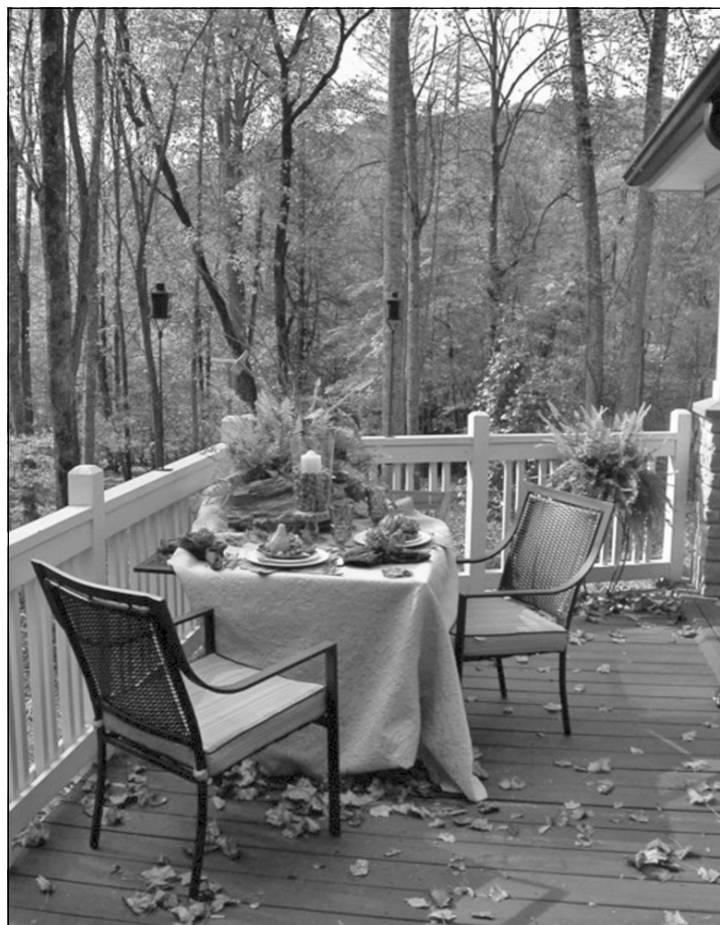
Прощание с летом.