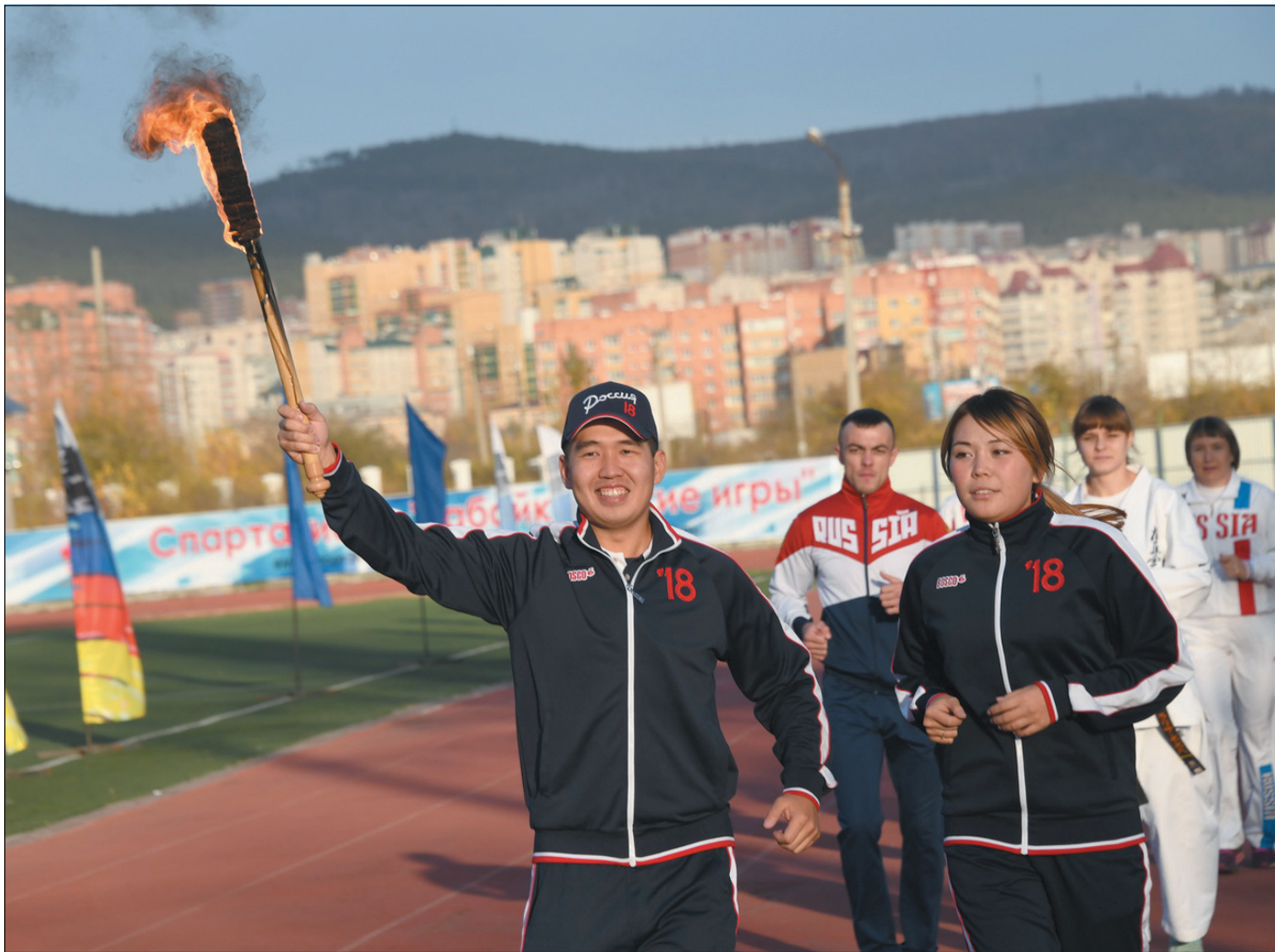
Словно на Олимпийских играх горела чаша с огнём на Читинском стадионе «Юность» во время проведения здесь IV краевой спартакиады «Забайкальские игры». Зажгли её лучшие спортсмены края. А игры и впрямь получились масштабные! Подробнее — на 1, 8 стр. в № 194.

В дни, пока горела, словно на Олимпийских играх, чаша с огнём, мужчины состязались в волейболе, гиревом спорте, мини-футболе, масс-реслинге. Среди женщин также прошли соревнования по волейболу, легкой атлетике, настольному теннису, дартсу. В заключи-