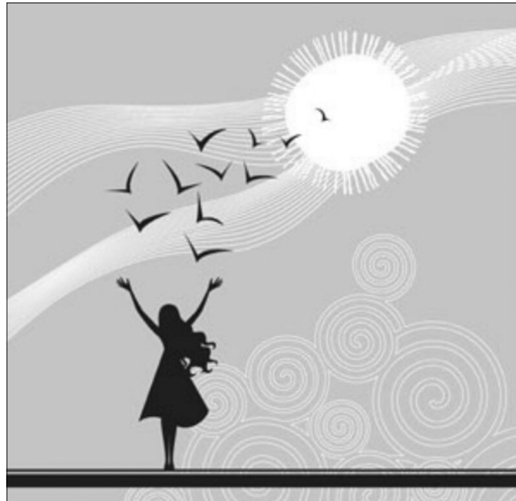
Одна из главных целей конкурса — выявление одаренных детей и подростков в области изобразительного искусства, проживающих на территории нашей страны.