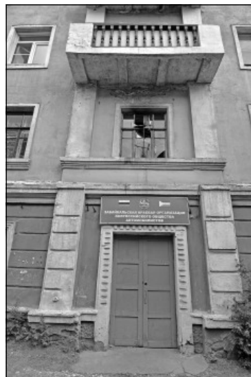
9 Января, 38. У этого здания тоже два адреса, здесь еще и Ленина, 54. Это знаменитый магазин «Темп».

в стиле эклектики, а главный фасад оштукатурен. Крупные оконные проемы... обрамлены профилированными наличниками с замковым элементом», — говорится в «Энциклопедии Забайкалья».