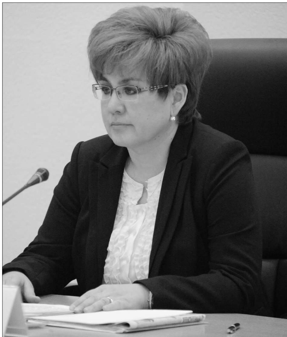
На заседании были подведены итоги детской оздоровительной кампании в крае.

— С учетом того, что материально-техническая база наших лагерей устарела, необходимо увеличить финансирование на их текущий и капитальный ремонт, а