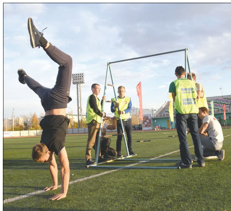
Эх, удаль молодецкая!