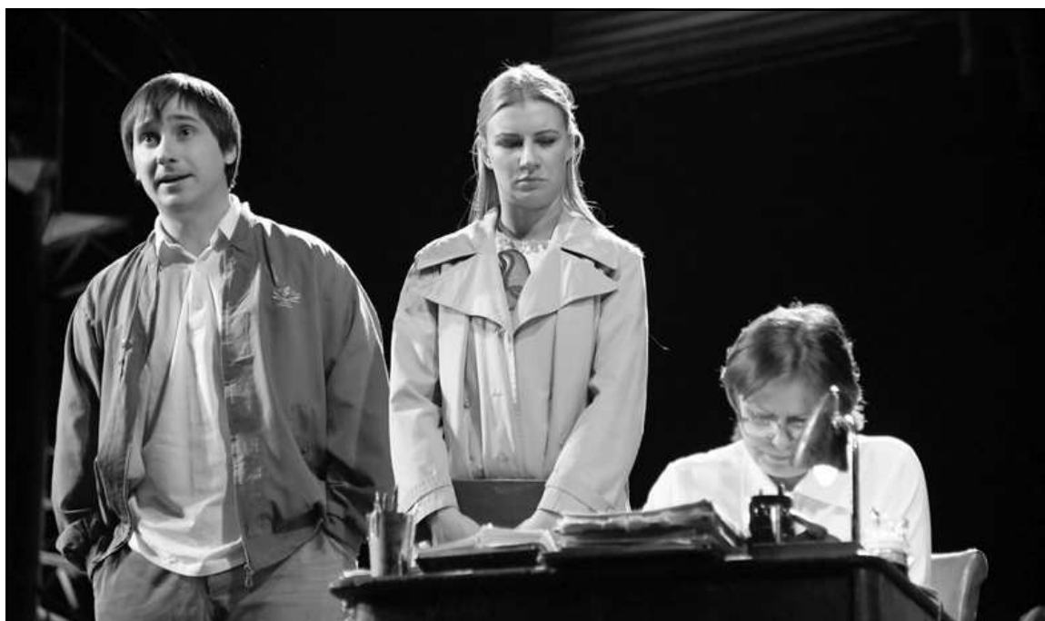
Выведывать секреты несчастливых семей, по долгу службы, приходится судье, вершащей бракоразводные процессы.