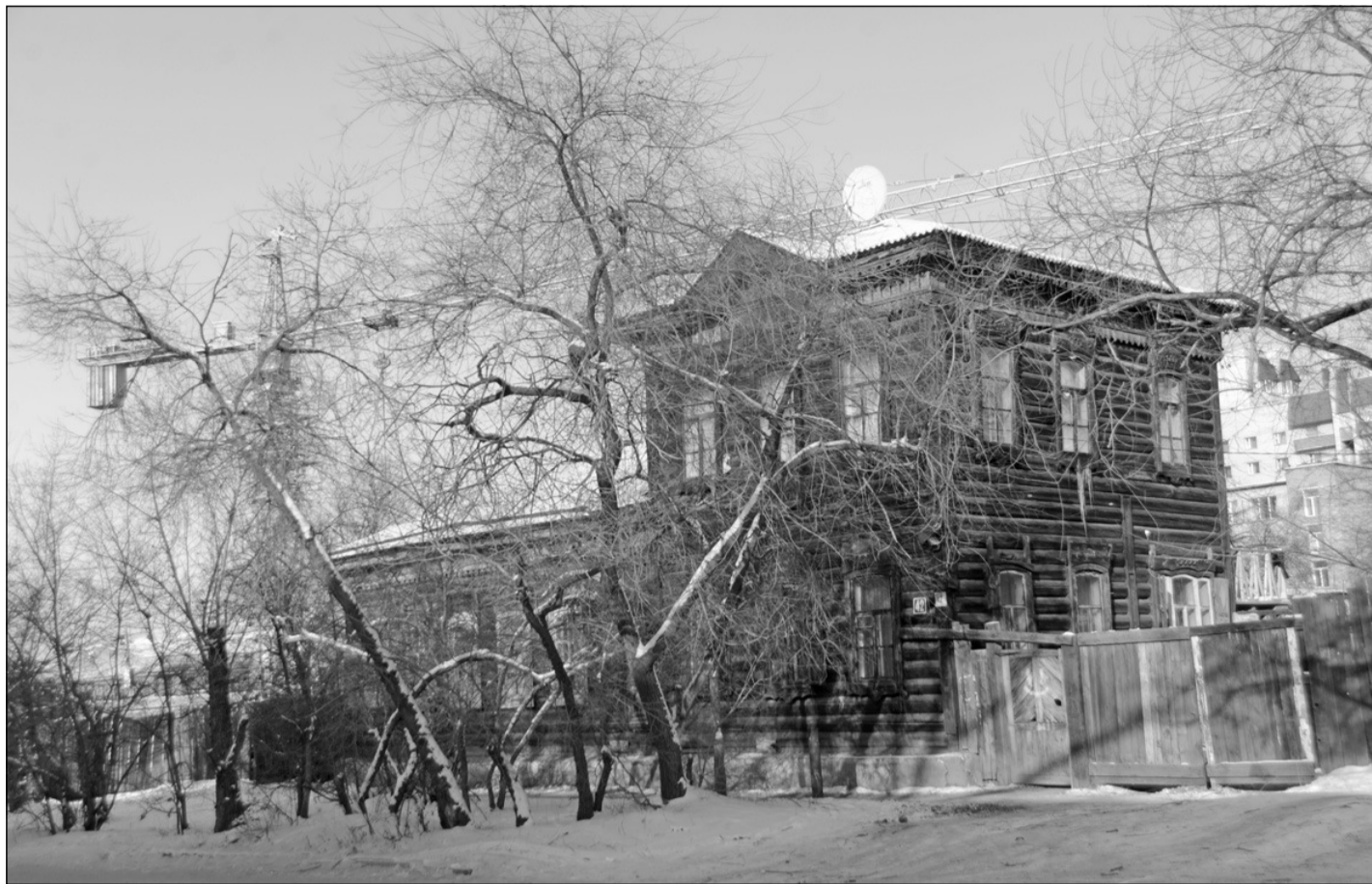
«Чита обладает серьезным, но пока не раскрытым в полной мере туристическим потенциалом», — так считают разработчики Стратегии социально-экономического развития столицы Забайкалья до 2030 года.

од до 2020 года, необходимо усилить продвижение российской сельскохозяйственной, машиностроительной и наукоемкой продукции на рынок Китая.