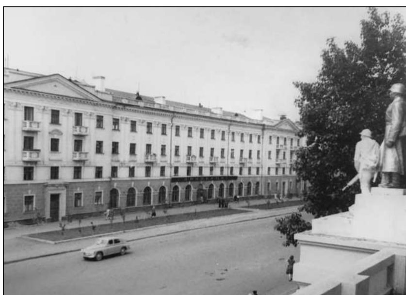
Магазин «Ткани», 1950-е годы.