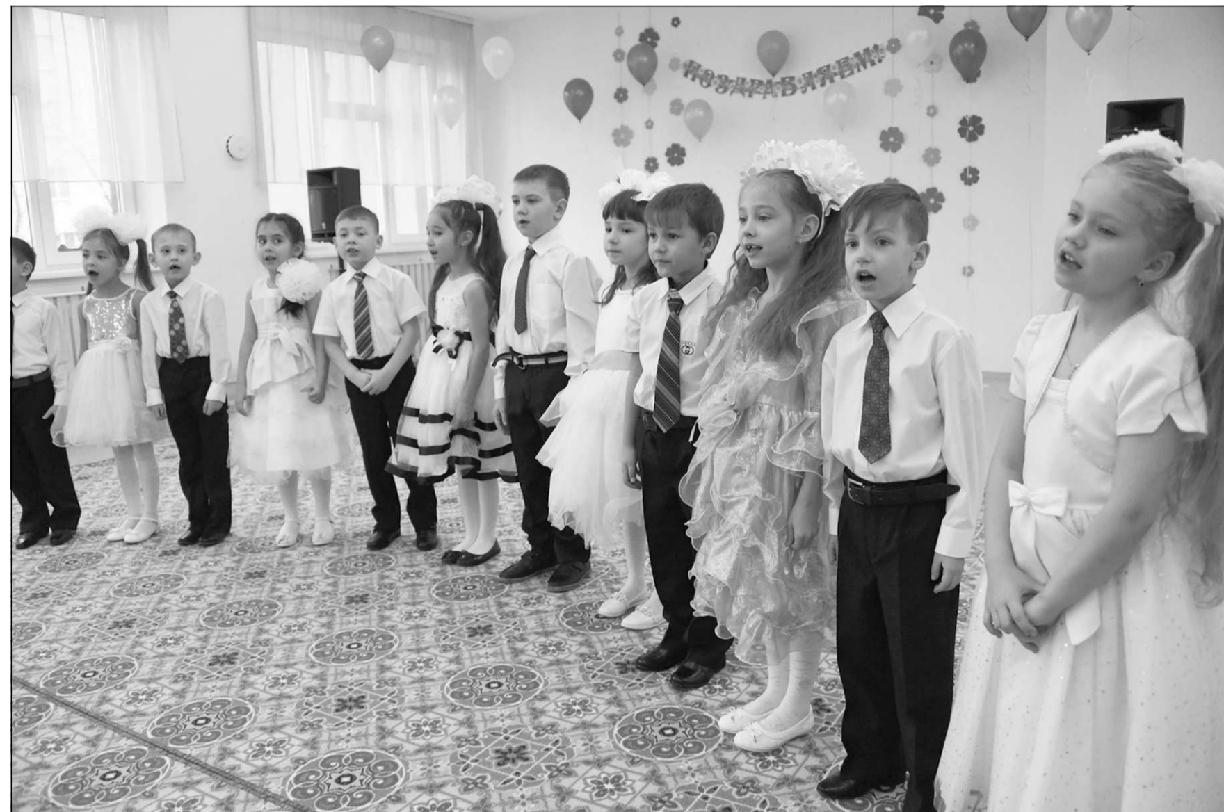
Реконструированный практически с основания детский сад «Журавушка» на улице Малой в Чите распахнул свои двери для 150 малышей.

Телефон доверия УФСБ России по Забайкальскому краю: 35-28-46.