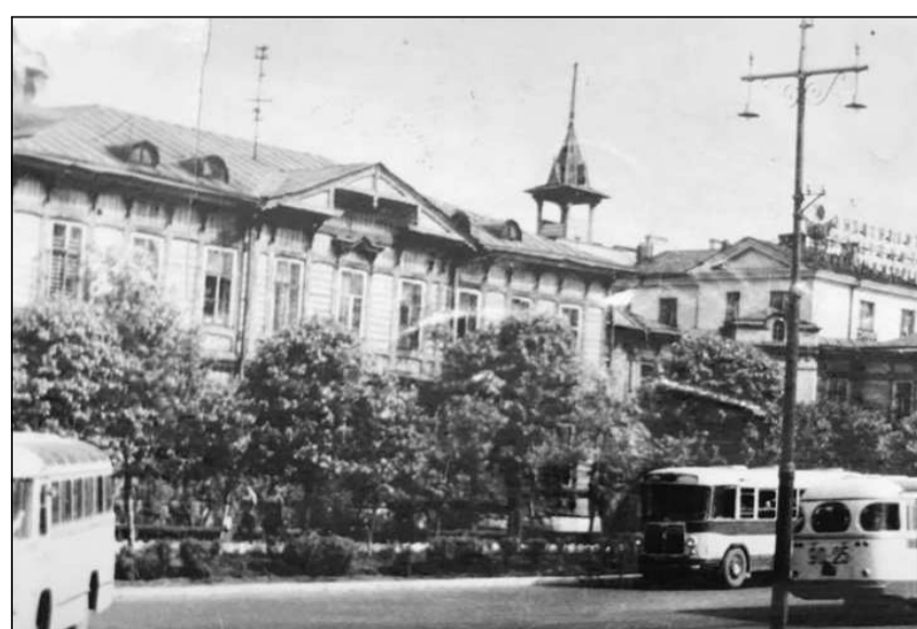
Площадь Ленина у почтамта. 1960-е годы.