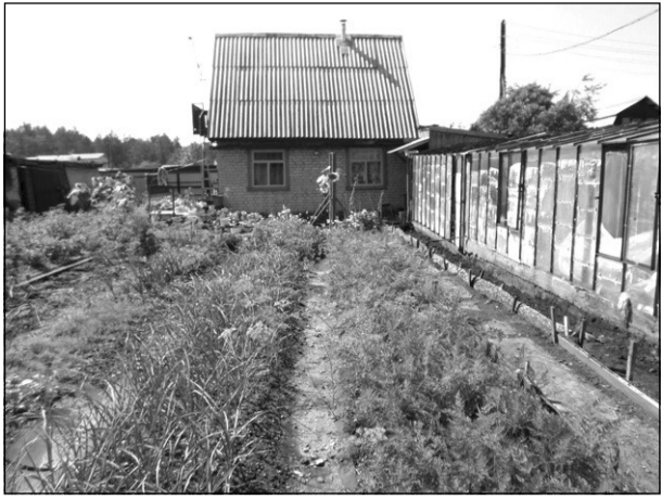
Строительство и реконструкция жилья должны соответствовать градостроительным нормам Читы.