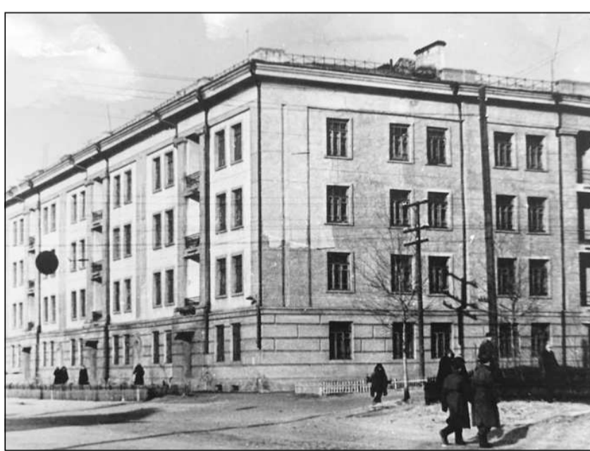
Перекресток ул. Ленинградской и Амурской, дата неизвестна.