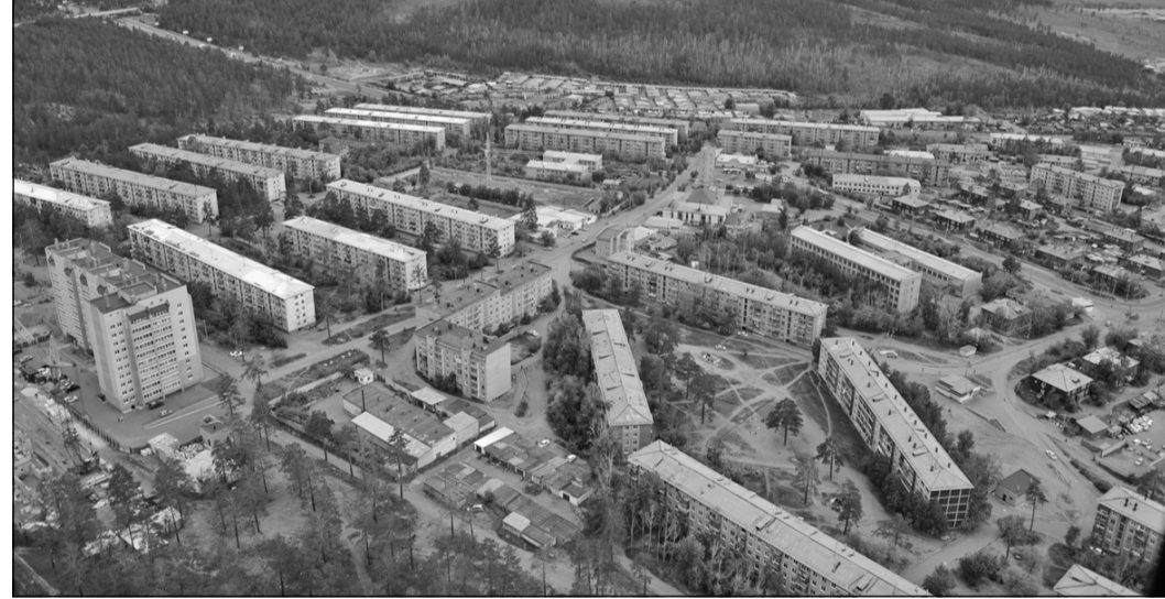
В ближайшее десятилетие Чита должна стать городом, интересным с экономической точки зрения, а также комфортным для жизни людей.

— Приоритетным направлением Стратегии является развитие внешнеэкономических связей России и Китая. Согласно Концепции долгосрочного социально-экономического развития России на пери-