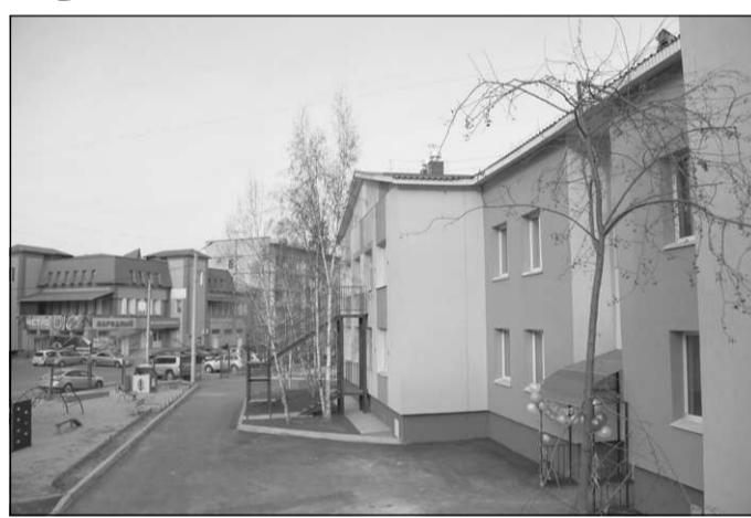
Новое здание детского сада украсило район улицы Малой.

Заведующая детским садом № 27 Наталья Щеголева не скрывала радости по по-