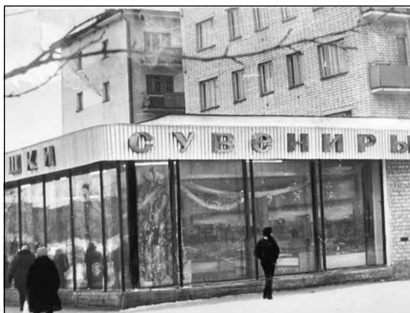
Магазин «Сувениры», 1970-е годы.