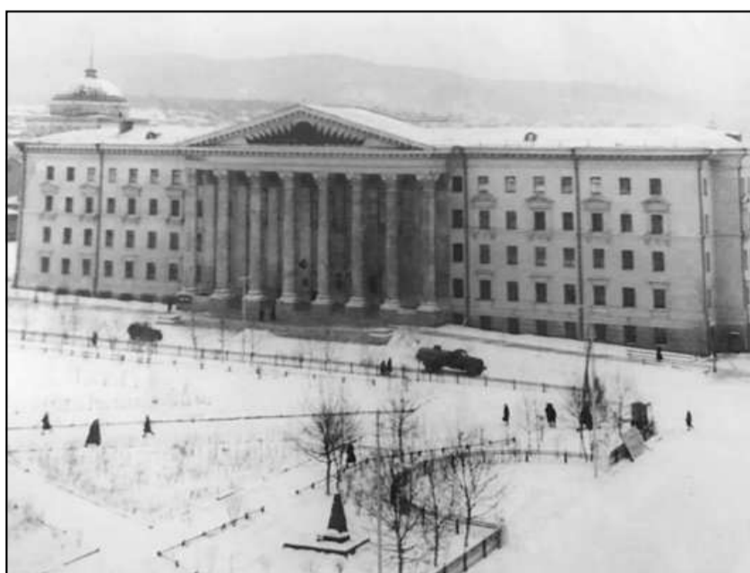
Площадь Ленина, 1950-е годы.

Подготовил Алексей БУДЬКО. Орфография и пунктуация сохранены.