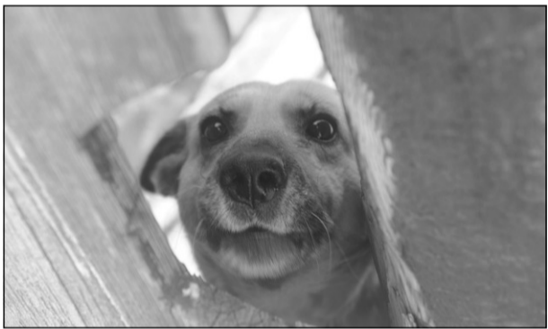
Новый питомник поможет отчасти решить проблему распространения в столице Забайкалья безнадзорных животных.