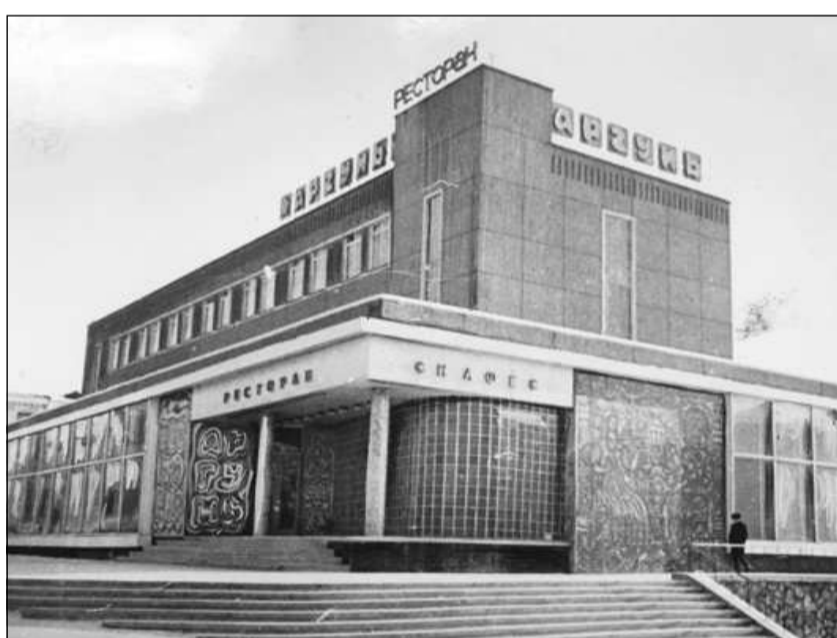
Ресторан «Аргунь», 1980 год.