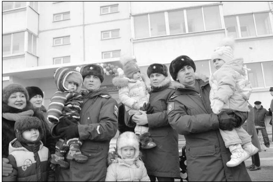
108 семей военнослужащих Читинского гарнизона получили в нём ключи от новых служебных квартир.