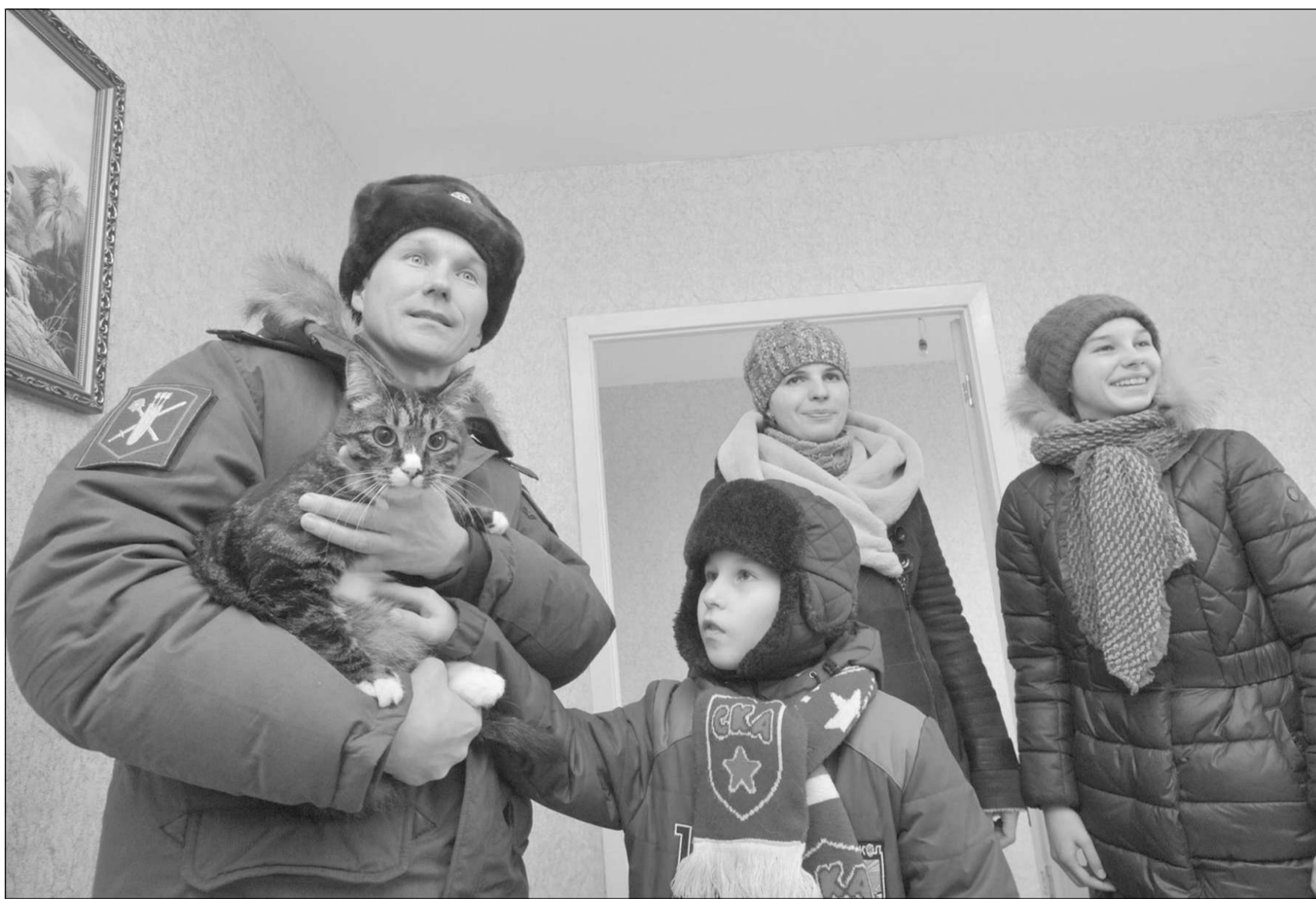
Счастливая семья новосёлов — одна из 108, получивших квартиры в новом доме на улице Июньской в Чите.