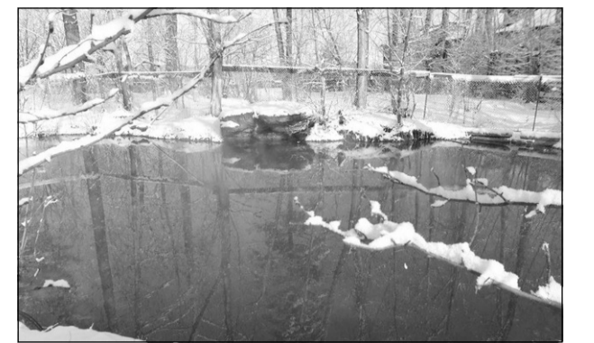
Теплая в любое время года минеральная вода озера Ямкун богата содержанием радона.