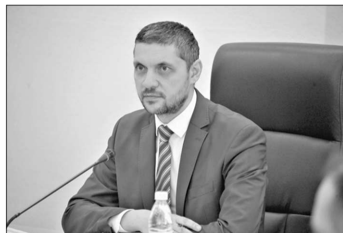
На заседании Госсовета РФ.

Региональная составляющая национального проекта «Здравоохранение» включает в себя шесть основных аспектов: развитие первичной медико-санитарной помощи, борьба с сердечно-сосудистыми и онкологическими заболеваниями, развитие детского здравоохранения, обеспечение медицинских организаций квалифицированными кадрами, внедрение но-