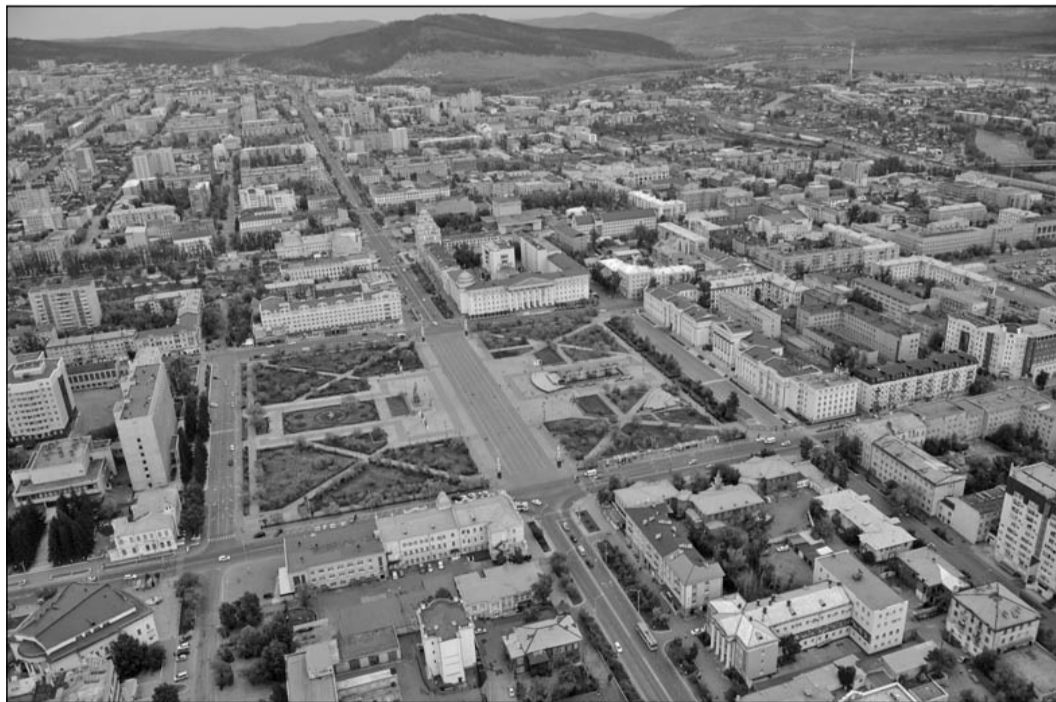
До марта 2019 года читинцам предстоит проголосовать за территории, которые будут благоустроены по федеральной программе.

Как отметил представитель комитета городского хозяйства администрации города, необходимо принятие Порядка организации и проведения тайного голосования по общественным территориям, обусловленная требованиями постановления Правительства Российской Федерации от 10 февраля 2017 года. Данный документ утверждает Правила предоставления и распределения субсидий из федерального бюджета бюджетам субъектов Российской Федерации на поддержку государственных программ субъектов Российской Федерации и муниципальных программ