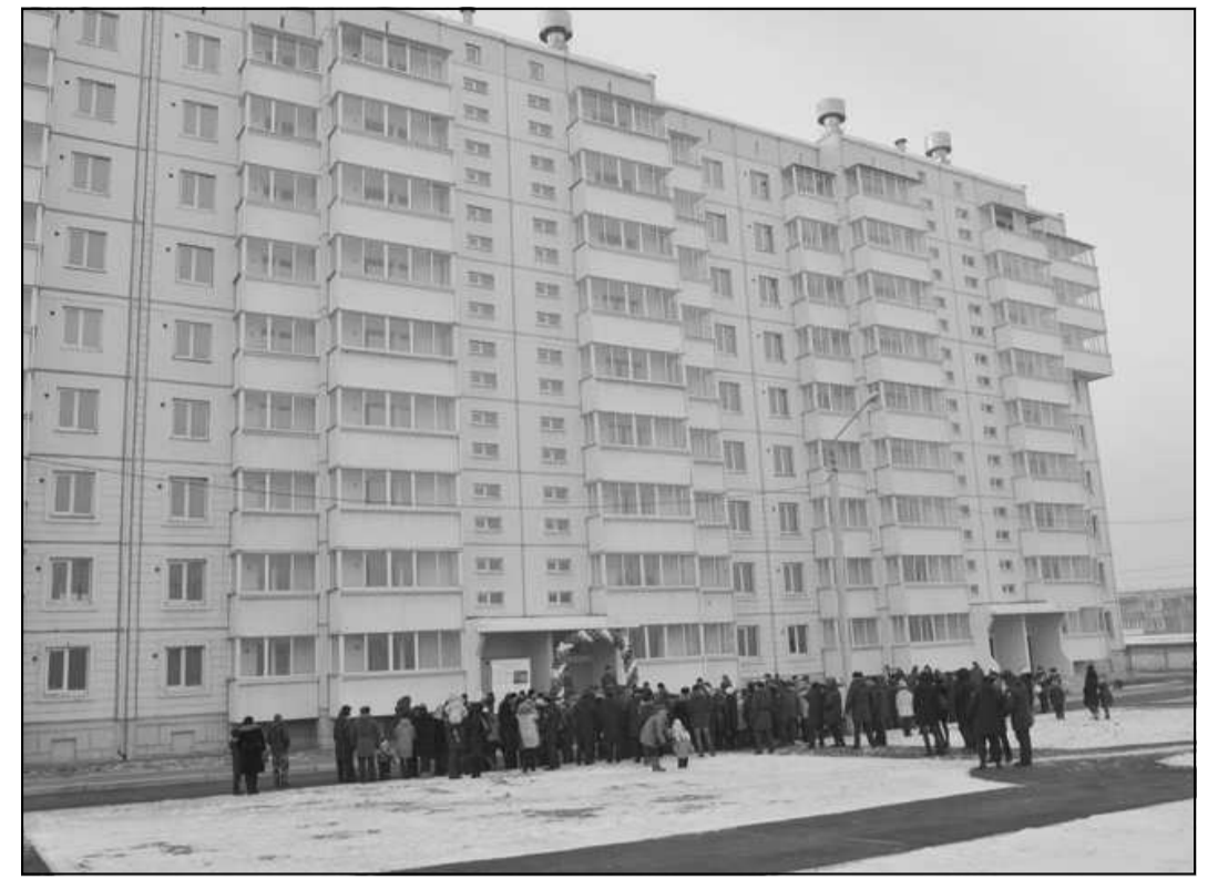
А этот девятиэтажный, трехподъездный дом был построен в Чите на деньги Министерства обороны.