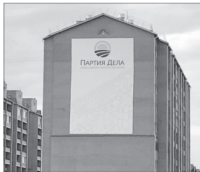
Реклама снятой с выборов Партии Дела на стене дома, который построила компания Виталия Гнатышена, — № 1 в партийном списке.