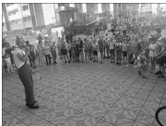
Праздник не успел закончиться, а дети уже спрашивали: «Когда будет следующий?»

всем, кто пришел в этот день на мероприятие. Орготдел администрации Центрального района.