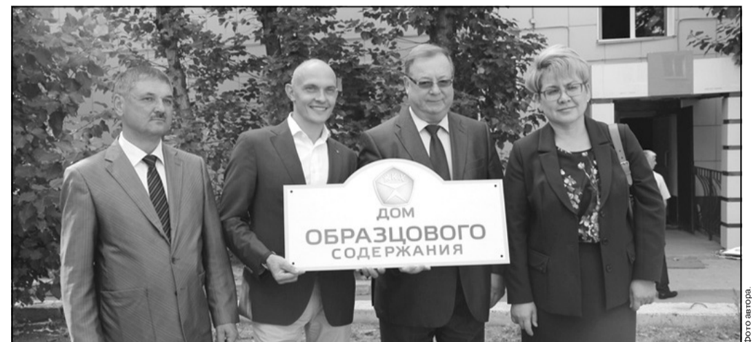
Почетные награды «Знак ЖКХ» и фасадная табличка «Дом образцового содержания» по улице Журавлева, 102 и его жильцам вручили председатель наблюдательного совета государственной корпорации — Фонда содействия реформированию жилищно-коммунального хозяйства Сергей Степашин и губернатор края Наталья Жданова.

Тепло и сердечно поздравил присутствующих со знаковым событием и руководитель администрации городского округа