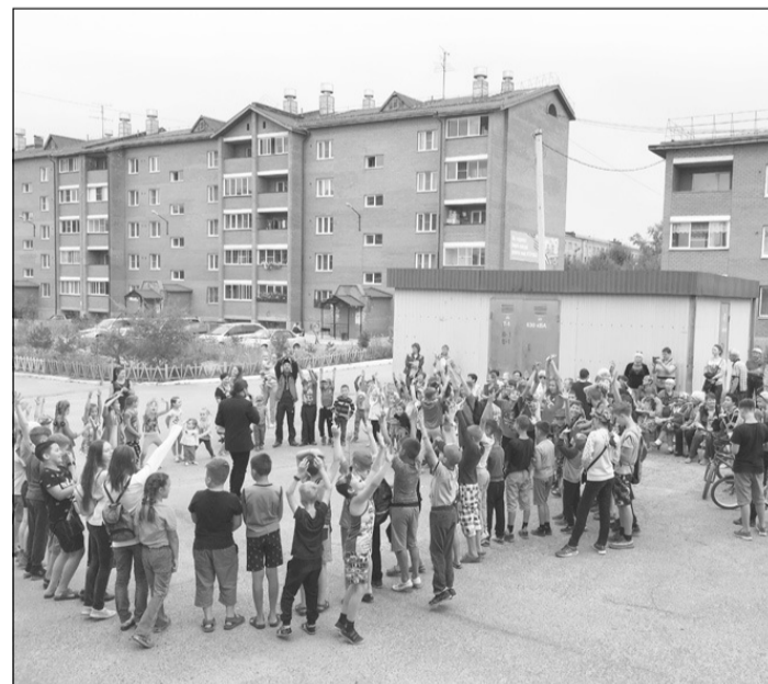
Праздники двора в посёлке Текстильчиков становятся всё более массовыми.