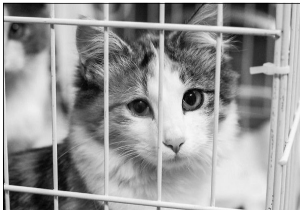
В приюте хорошо, а дома лучше!