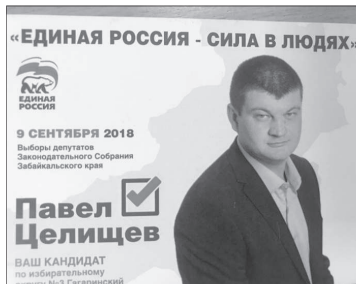
Некоторые кандидаты решили использовать малые форматы — календари карманного формата.