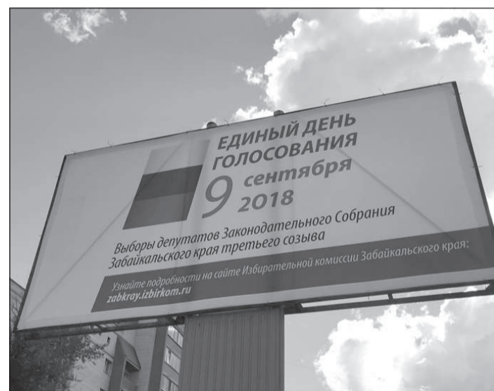
Своя наглядная агитация, традиционно, была и у краевой избирательной комиссии.