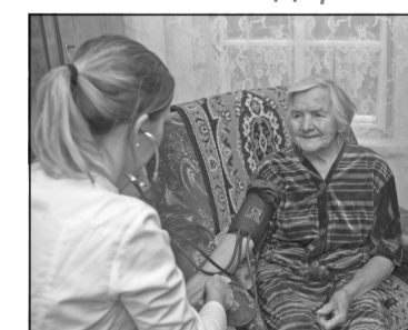
Пенсионерам и ветеранам были вручены цветы и проведены профилактические осмотры терапевтами.

Также в рамках проведения сетевой акции, посвященной 15-летию ОАО «РЖД», в период с 1 по 15 октября 2018 года проводится акция, в рамках которой предоставляется скидка 15% при заключении пациентами индивидуального дого-