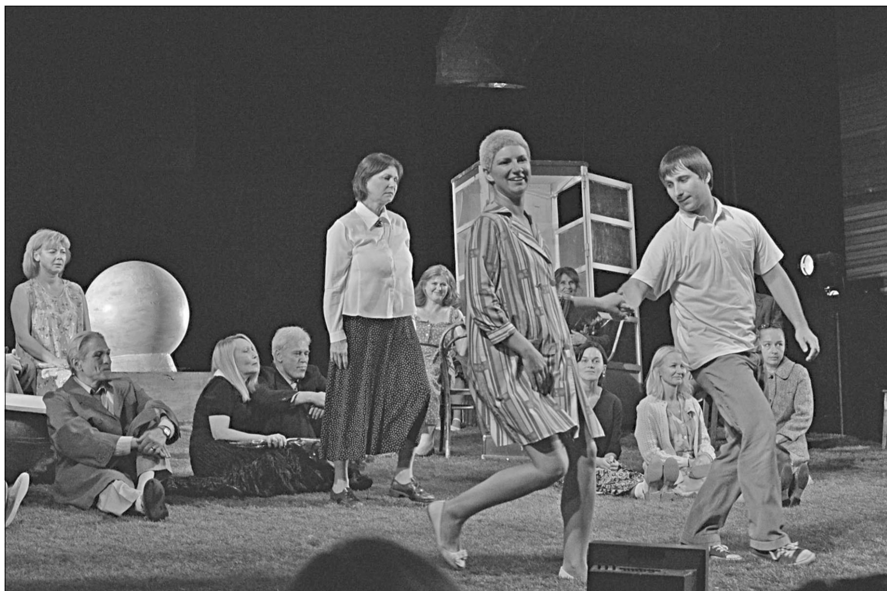
Спектаклем, открывшим фестиваль «Золотая маска» в Чите, стала постановка Генриетты Яновской «С любимыми не расставайтесь» по пьесе Александра Володина, являющаяся жемчужиной Московского театра юного зрителя.