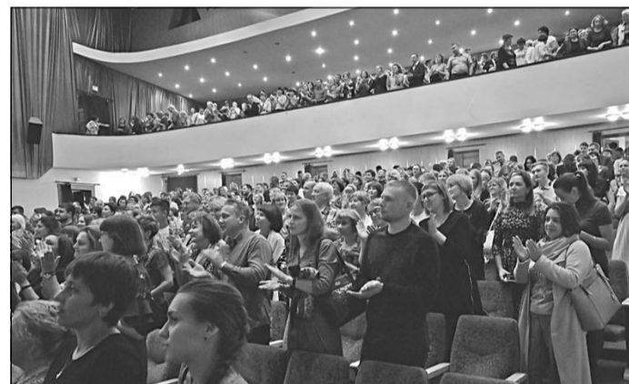
Новая постановка хорошо известной истории тронула сердца забайкальских зрителей.

Спектаклем, открывшим фестиваль «Золотая маска» в Чите, стала постановка Генриетты Яновской «С любимыми не расставайтесь» по пьесе Александра Володина, являющаяся жемчужиной Московского театра юного зрителя. Спектакль является лауреатом премии К.С. Станиславского в номинации «Событие сезона». Данное произведение, знакомое многим по одноимённому фильму, рассказывает зрителю о высокой цене расставания