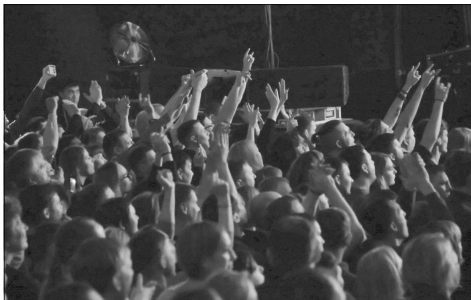
После основной части и последней спетой композиции 2018 года «Любовь не пропала» зал встал с мест с оглушительными аплодисментами.