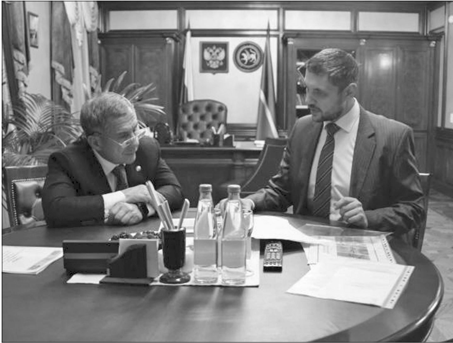
Стороны обсудили вопросы обмена опытом на межрегиональном уровне по ряду актуальных направлений.