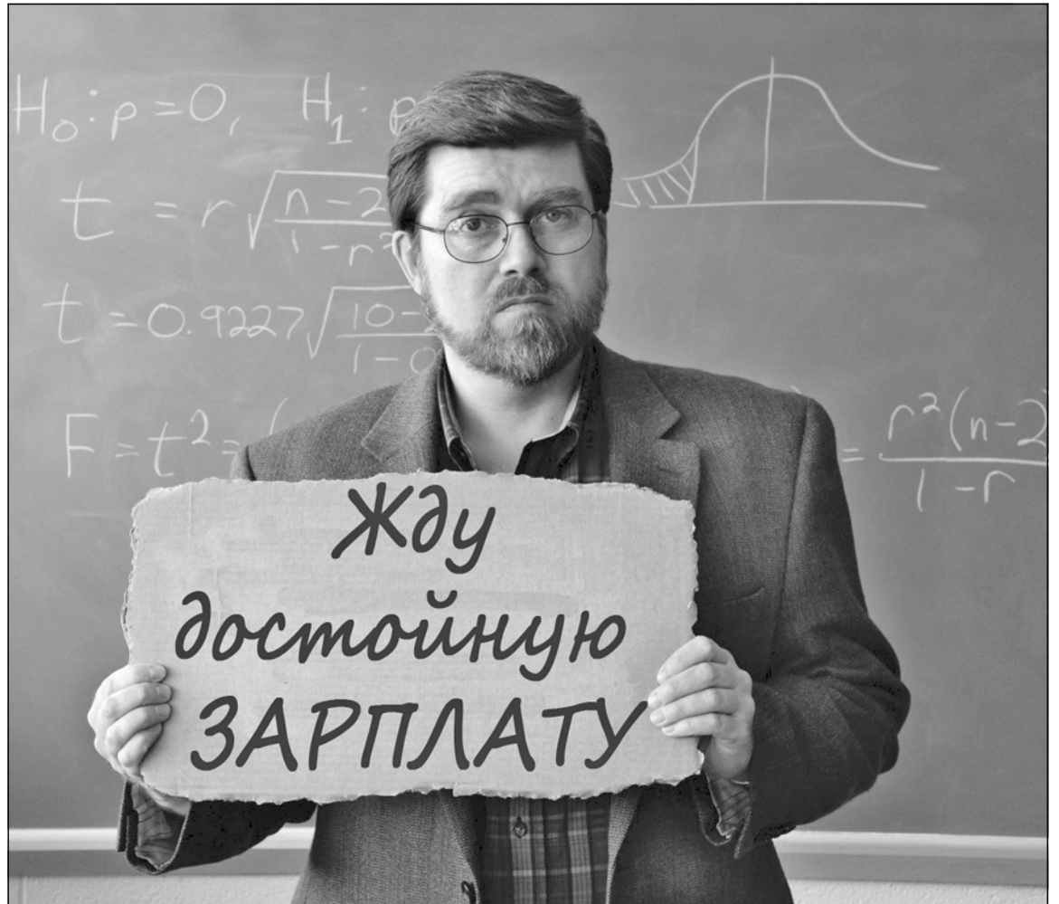
Необходимо тщательно разобраться в сложившейся ситуации.