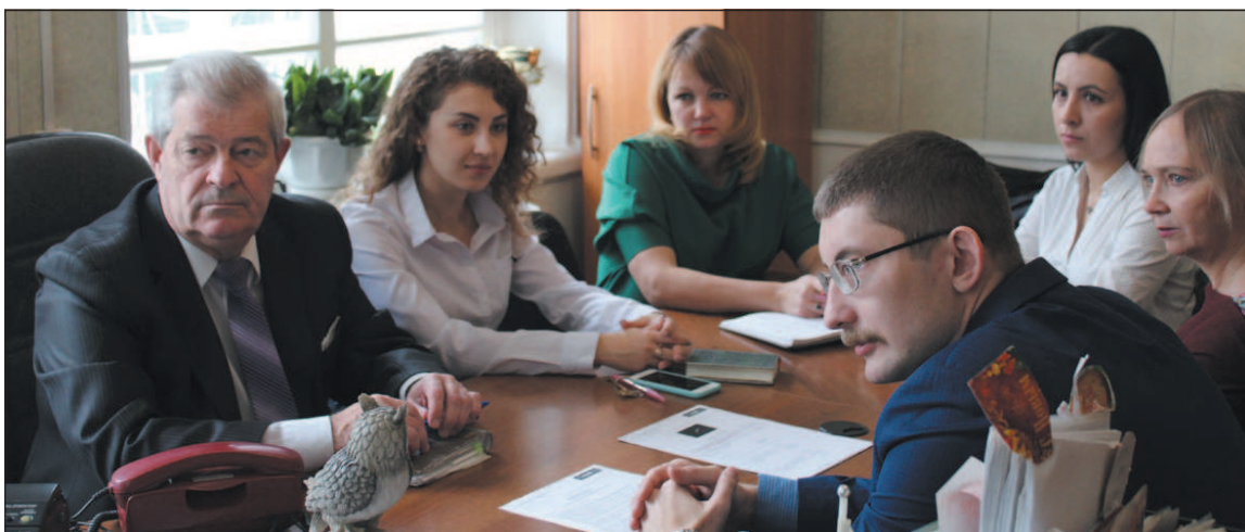
В июле 2018 года прошло совместное совещание с уполномоченным органом по вопросам оказания бесплатной помощи в затопленных районах края.