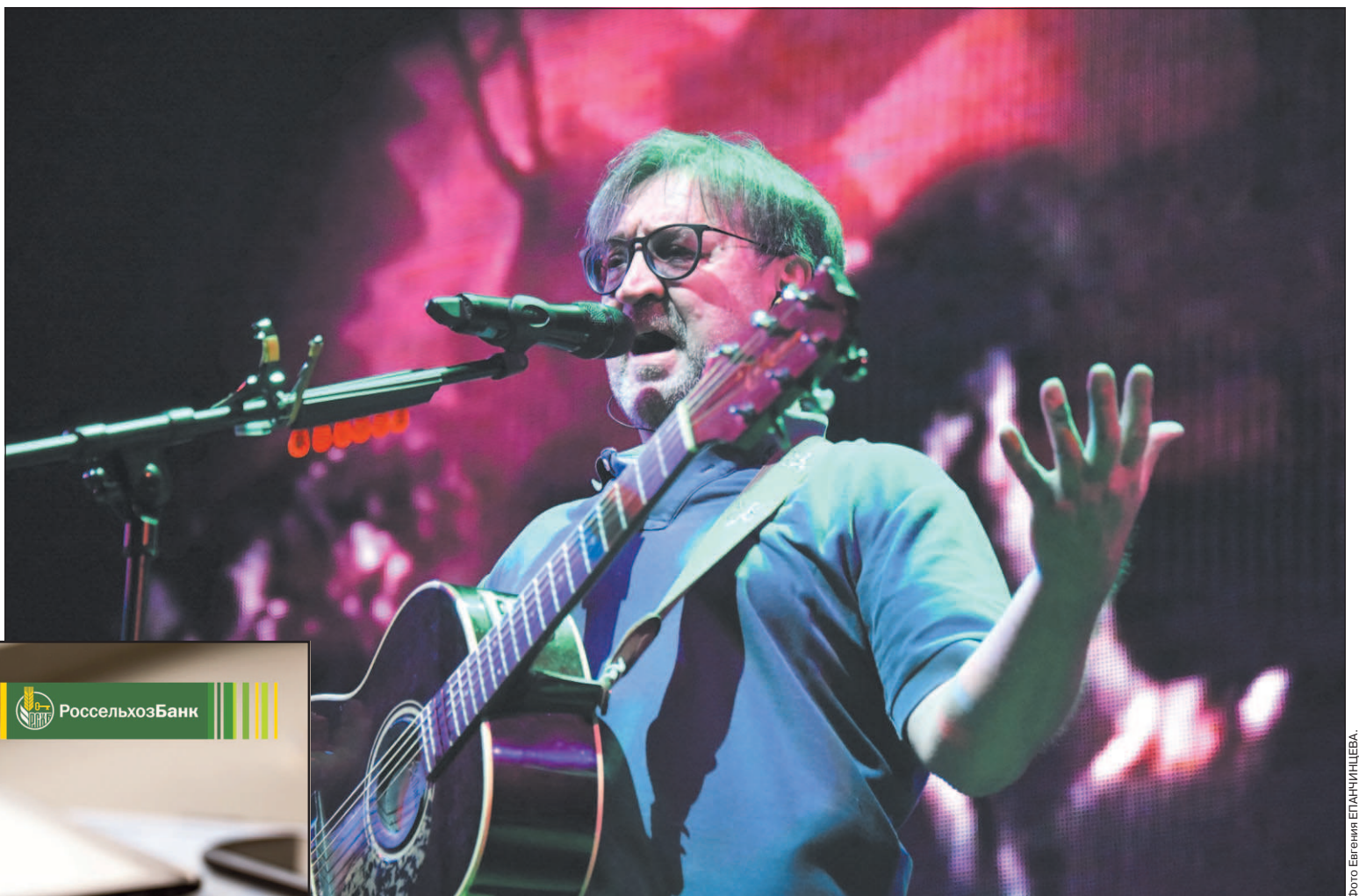
Четыре десятилетия — один «ДДТ». Подробности на 7-й стр. № 237.

Телефон доверия УФСБ России по Забайкальскому краю: 35-28-46.