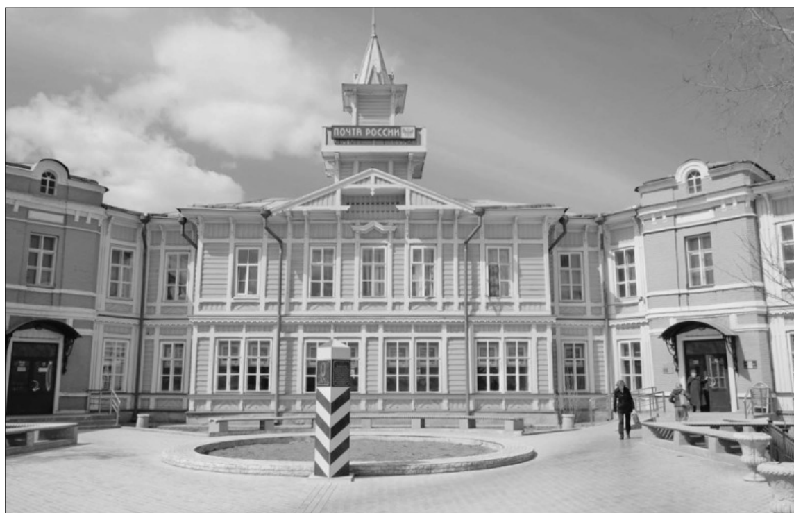
В 1956 году Читинскую почтовую контору переименовываю в Читинский почтамт.

В 1809-1810 годах на восточной окраине острога (ныне дома 39 и 40 улицы Аянской) построили новый почтовый дом. В 1828 году при почтовой станции была открыта Читинская контора по приёму, выдаче и пересылке корреспонденции. Но этого было мало, почта в Чите оставалась перегруженной. Когда же в Читинский острог начали привозить декабристов, ситуация обострилась: стало поступать невиданное ранее количество писем, инструкций, наставлений