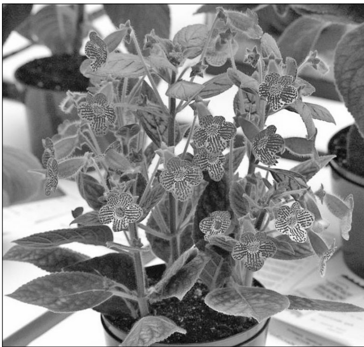
С лета и до самых морозов радуют глаз эти пёстрые цветочки.

Влажность воздуха. Обычная для комнат в жилом поме-