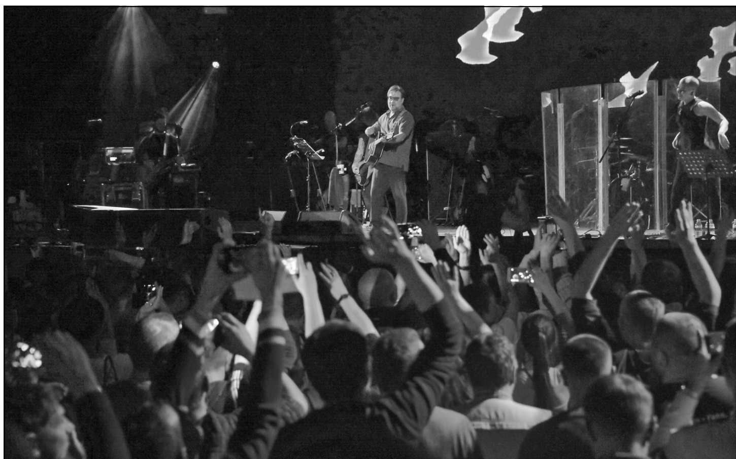
После насыщенных 1990-х, в блоке «нулевых» годов прозвучали песни «Чай», «Любовь», «Просвистела», «Песня о свободе». Незабываемый момент — это исполнение композиции «Августовская метель + Когда один», стихотворение под музыку пробрало до мурашек и запало в самое сердце.

Юрий Юлианович спросил: «Кто из вас родился в СССР?» Оказалось, что больше половины зала. Остальные родились уже в РФ. Лично для меня это очень приятно, я рада, что среди поклонников ДДТ много молодых ребят. А потом звучали