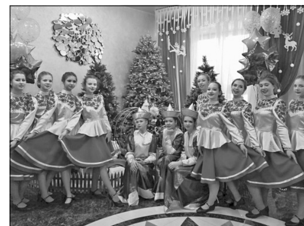
Быть участником ансамбля «Вдохновение» в Шилке почётно и престижно.