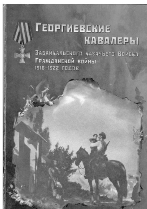
В пяти томах этой серии названы имена порядка 10 тысяч забайкальцев.