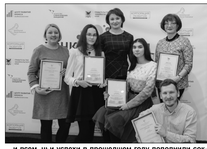
...и всем, чьи успехи в прошедшем году пополнили сокровищницу культуры Забайкалья.