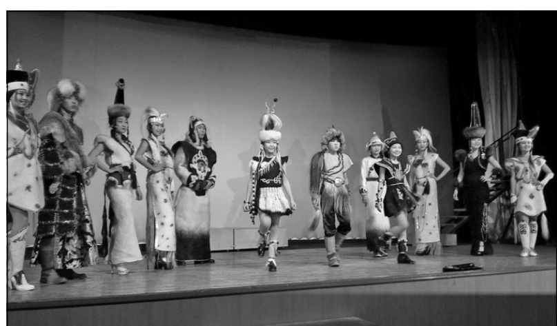
Открытие года прошло, как настоящий праздник.

На торжественной церемонии открытия были награждены победители первого окружного конкурса мультфильмов на бурятском языке, воспитанники детского кукольного театра «Неспеседы» Агинского Дома детско-