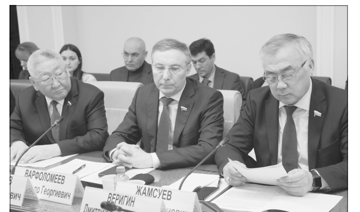
Во время заседания «круглого стола».