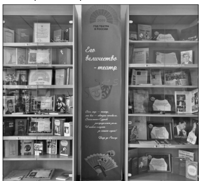
Книжная выставка предлагает заглянуть в мир искусства и узнать его тайны.

«Год театра, которым объявлен 2019-й, — это очень важное событие для культуры страны, для формирования общественного сознания. Одной из основных задач проведения Года видится возможность сделать театр частью жизни каждого из нас. История те-