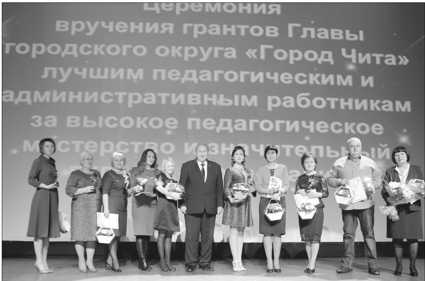
В 2018 году в конкурсе приняли участие 59 человек.

участие 59 человек. В очный этап вышли 53 специалиста. Лучшими из них, по традиции, признали десять работников образования, которые удостоены грантов на сумму 100 тысяч рублей.