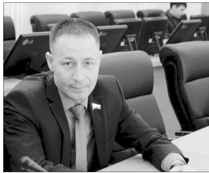
«Молодежному парламенту нужна динамика, хайп, драйв, неформальный подход к проведению мероприятий», — считает глава парламентского комитета Георгий Шилин.

— Есть ли какие-то нововведения или Молодежный парламент формируется по прежним правилам?