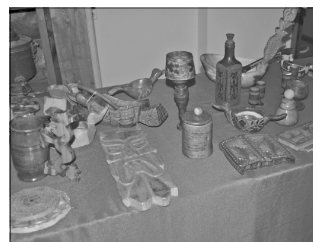
Многие деревянные изделия выполнены в старинном русском стиле.