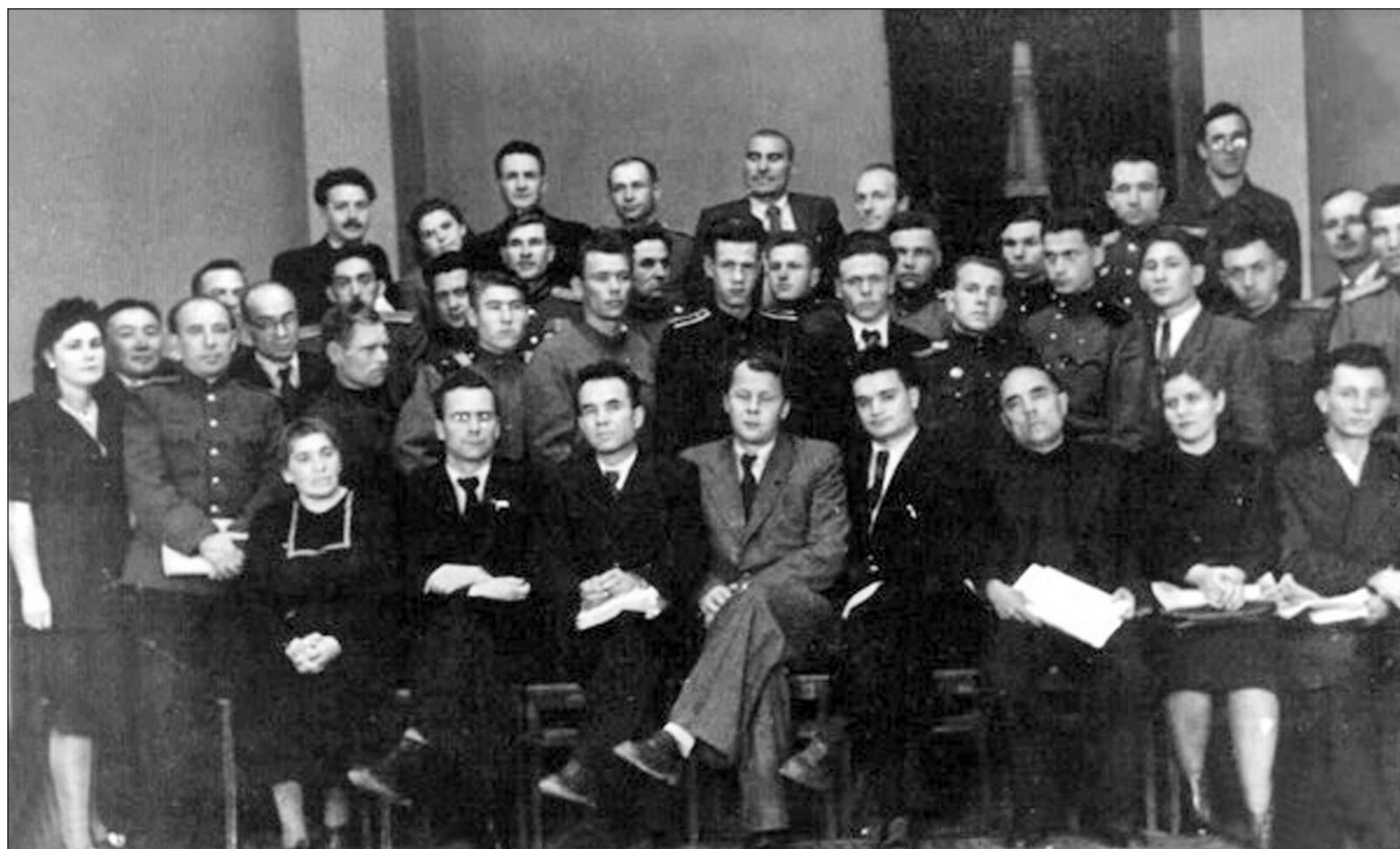
Фото сделано в Чите в 1949 году. В центре — поэт Александр Твардовский, слева от него Константин Седы, в последнем ряду четвертый справа — Иннокентий Луговской.

говскому. Он сразу посерьезнел и, посопев погасшей трубкой, тихо сказал: "Оставь как есть".