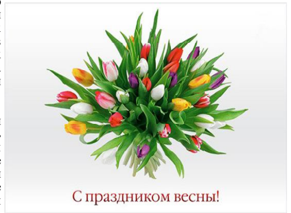
С праздником весны!

Материал подготовлен Светланой СВЕТИКОВОЙ