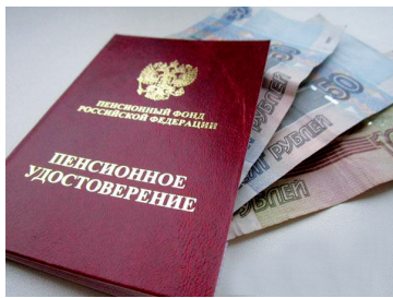
Условия «сельхознадбавки» к пенсии - с. 5