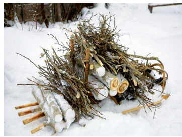
Соблюдайте правила сбора валежника - с. 5