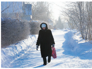
Как и почему меняются тарифы на услуги ЖКХ - с. 4