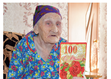
Два столетних юбиляра в районе на одной неделе - с. 7