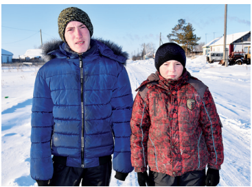
Школьники из Кирсановки спасли человека - с. 4