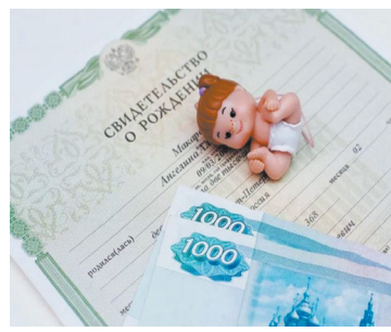
Всё о выплате пособий 10 тысяч семьям с детьми - с. 10