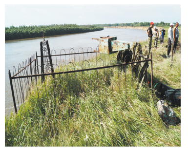
Деревенский погост спасут от обрушения - с. 13