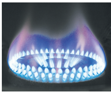
Газификация в деталях в «Диалоге с главой» - с. 4-5

ВНИМАНИЕ! С 1 ПО 10 ИЮНЯ - ДЕКАДА ПОДПИСКИ НА ВТОРОЕ ПОЛУГОДИЕ 2020 ГОДА ВО ВСЕХ ПОЧТОВЫХ ОТДЕЛЕНИЯХ РАЙОНА! ЦЕНА СНИЖЕНА!!! ОБРАЩАЙТЕСЬ К ПОЧТА- ЛЬОНАМ ИЛИ ЗВОНИТЕ В РЕДАКЦИЮ 2-23-40. ОСТАВАЙТЕСЬ В КУРСЕ НОВОСТЕЙ СВОЕГО РАЙОНА!