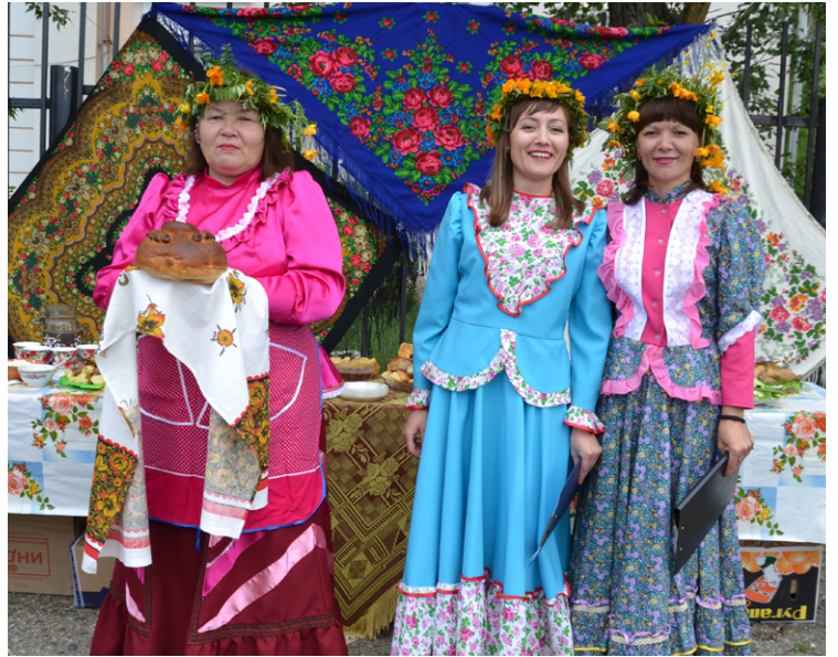
Хлеб-соль от верхнеульхунцев

Русская кухня считается одной из самых сытных, вкусных и богатых. Ее представили на фестивале жители сел Мангут и Мордой. Мангутяне показали небольшую сценку про королевишну, которая кушать не хотела, несмотря на матушкины уговоры. Зря она отказалась от таких угощений, поистине царских: вареники, всевозможные пирожки, фаршированная рыба, каша и квас. Стол участников из Мордой украсил