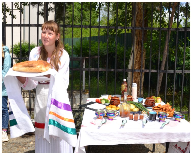
Гостей встречают белорусы