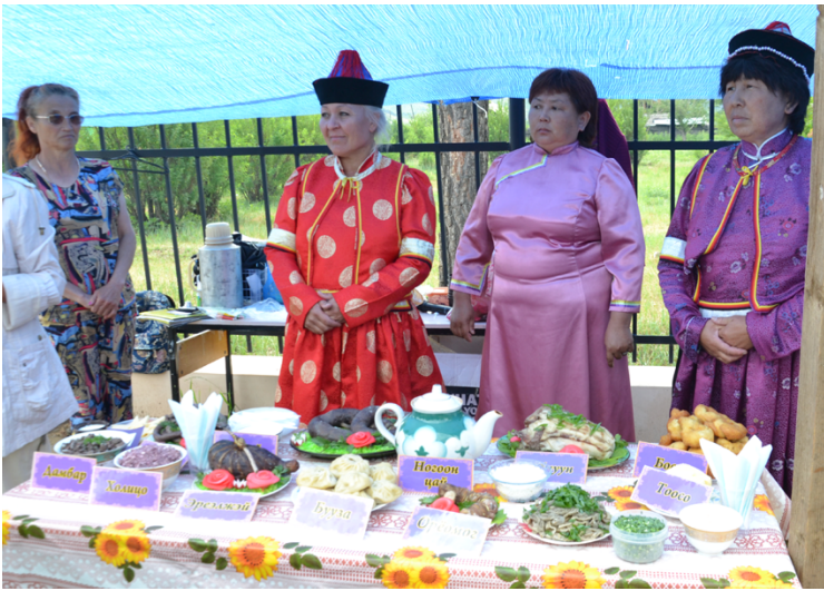
Бурятский мясной стол