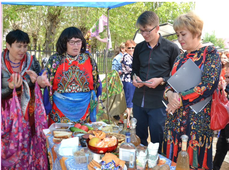
У цыганского стола