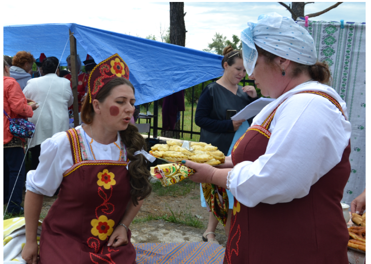
Привередливая королевишна из Мангута