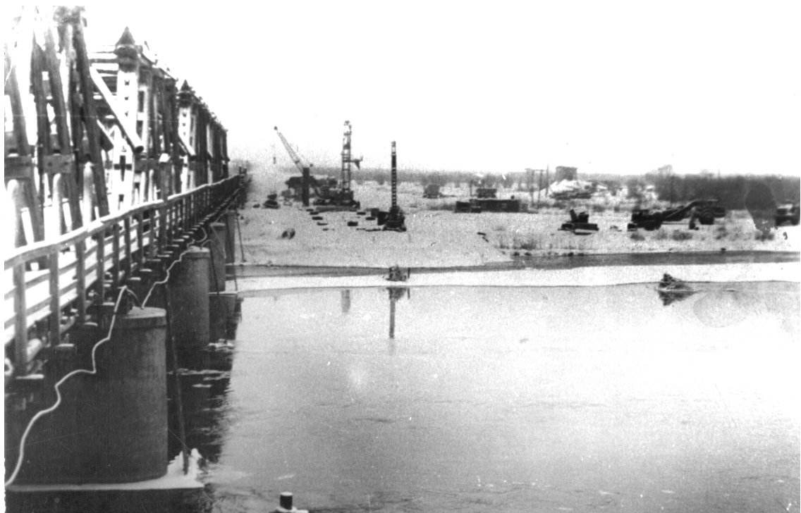
Мост через Онон в период строительства