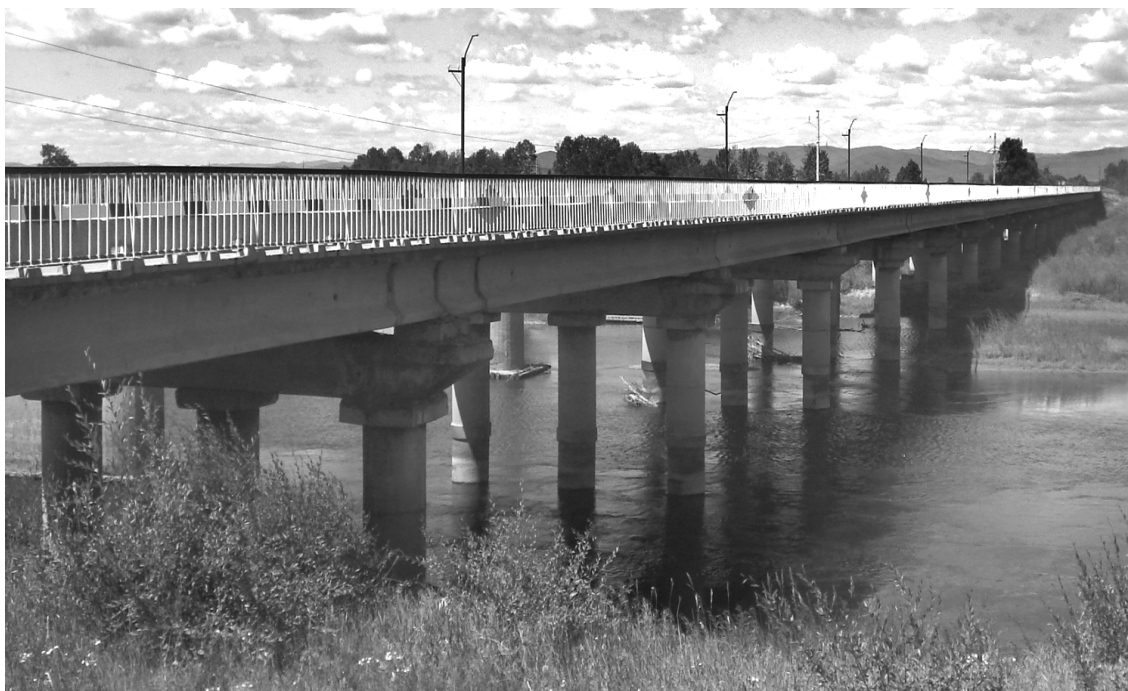
Мост в наши дни