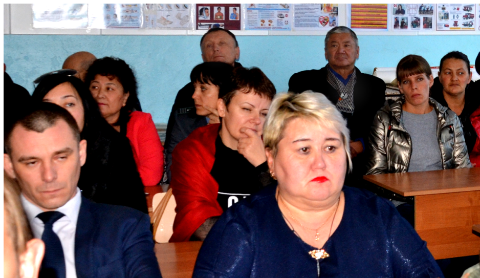
Встреча в Мангутском училище