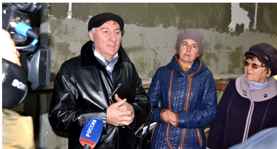
Интервью для ЧГТРК в Верхнеульхунской школе