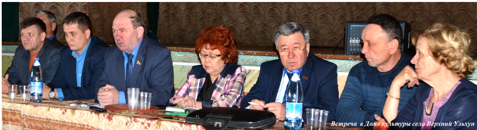
Встреча в Доме культуры села Верхний Ульхун