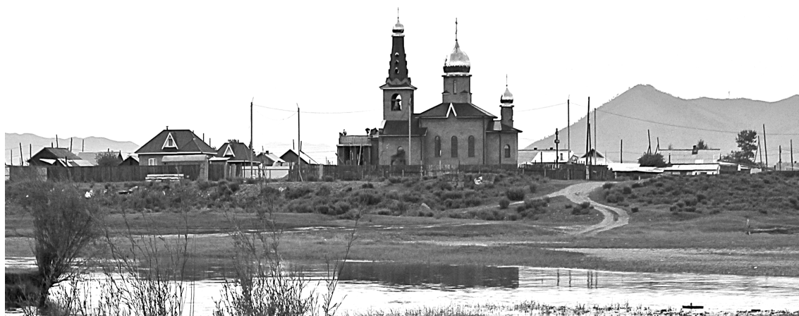
Храм Николая Чудотворца в Мангута строится всем миром. Здание в целом готово, остались отделочные работы и установка иконостаса