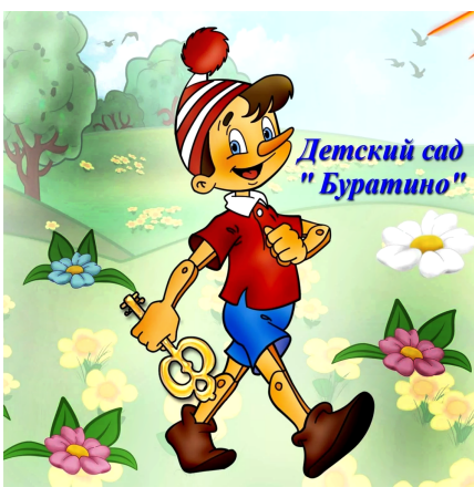
Детский сад "Буратино"