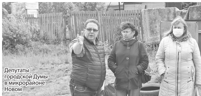
Депутаты городской Думы в микрорайоне Новом