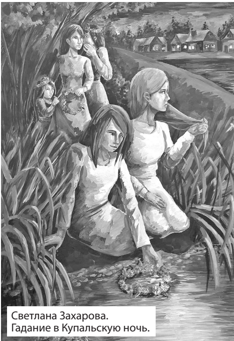
Светлана Захарова. Гадание в Купальскую ночь.