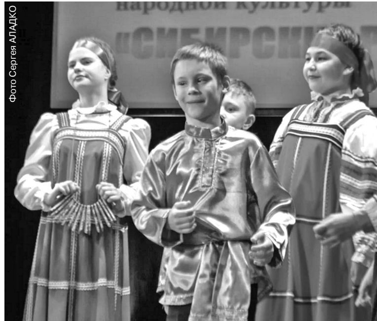
Фольклорный ансамбль «Ладушки»