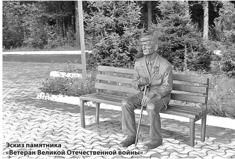
Эскиз памятника «Ветеран Великой Отечественной войны»

Скульптура будет изображать пожилого мужчину с орденами