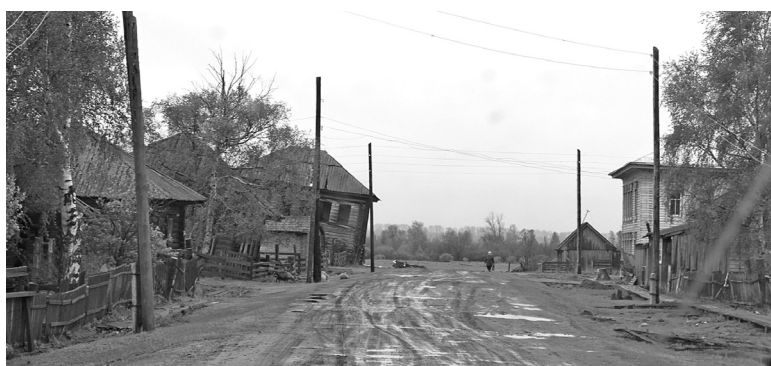
В Нарыме что ни дом, то памятник, причём регионального или федерального значения

Нарым основан приблизительно в 1596-1597 годах (для сравнения: Томск — в 1604-м). Однако люди селились там с незапамятных времен. И хотя у села большая история, знаменито оно тем, что стало центром политической ссылки. Это труднодоступный край с суровой природой. Здесь при малых затратах можно было содержать много неугодных правительству людей. Тюрьма без решёток. Поэтому уже в первых острожных документах встречаются имена ссыльных — участников крестьянских восстаний Степана Разина и Емельяна Пугачёва. Следующими в документах значатся декабристы, входящие в тайное общество соединённых славян, образованное в 1823 году. Из наиболее известных — Николай Мозгалевский и Павел Выгодский.