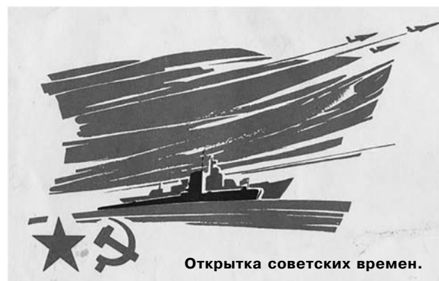
Открытка советских времен.