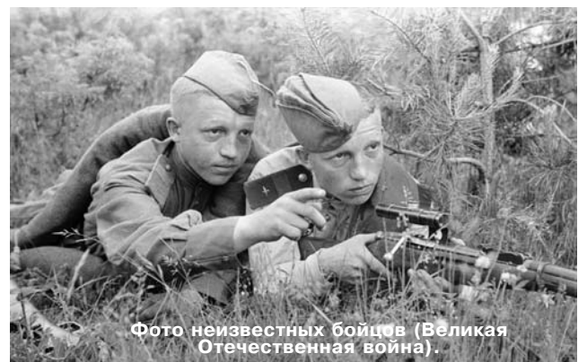
Фото неизвестных бойцов (Великая Отечественная война).