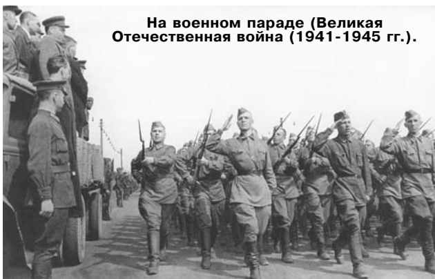
На военном параде (Великая Отечественная война (1941-1945 гг.).