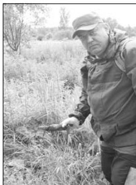
У братской могилы, саперная лопатка (возможно, ею дед окапывался в бою).