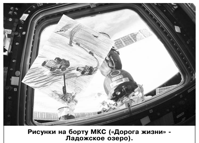
Рисунки на борту МКС («Дорога жизни» - Ладожское озеро).