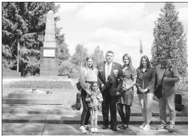
Мемориальный комплекс «Синявинские высоты».