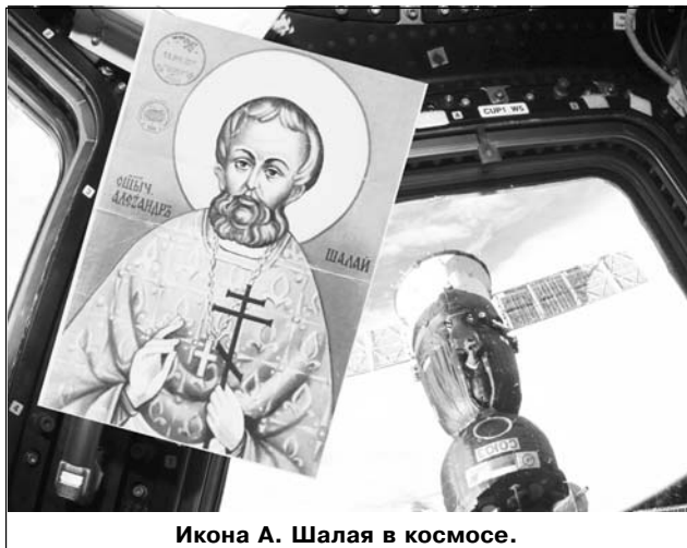
Икона А. Шалай в космосе.