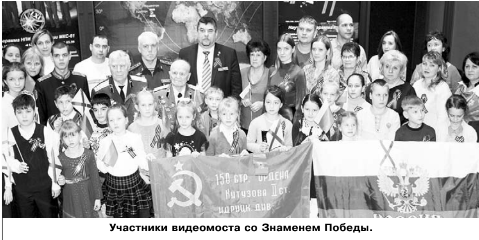
Участники видеомоста со Знаменем Победы.