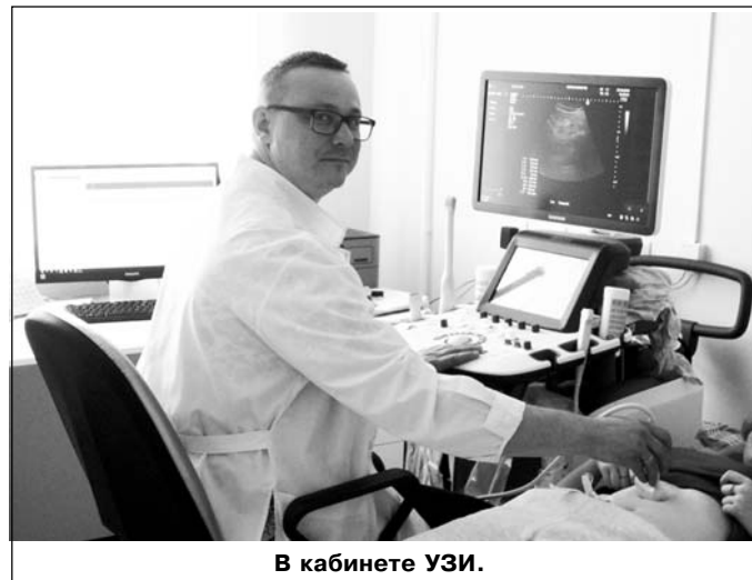
В кабинете УЗИ.

По поводу утери карточки он пояснил, что врачи в этом совершенно не заинтересованы, так как карточка - это тот документ, по которому страховые компании платят больнице