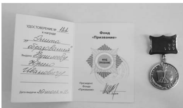
НА СНИМКЕ: награда Ю. И. Бушлеева.