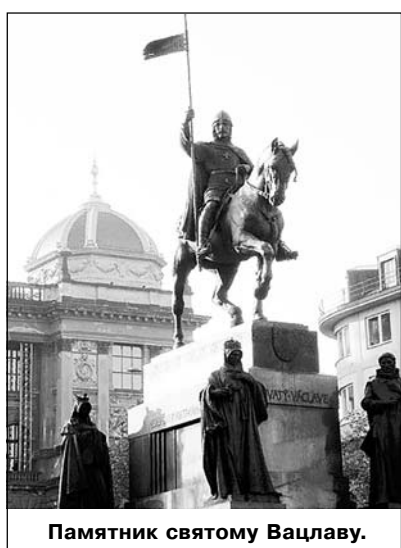
Памятник святому Вацлаву.