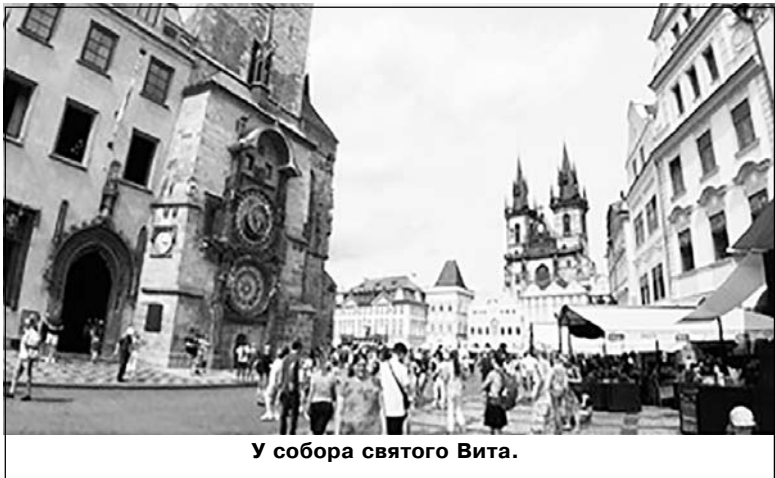
У собора святого Вита.

Кстати, про Аллу Пугачёву я вспоминаю не случайно - она тоже связана с городком, где мы побывали. Здесь по сей день существует фабрика