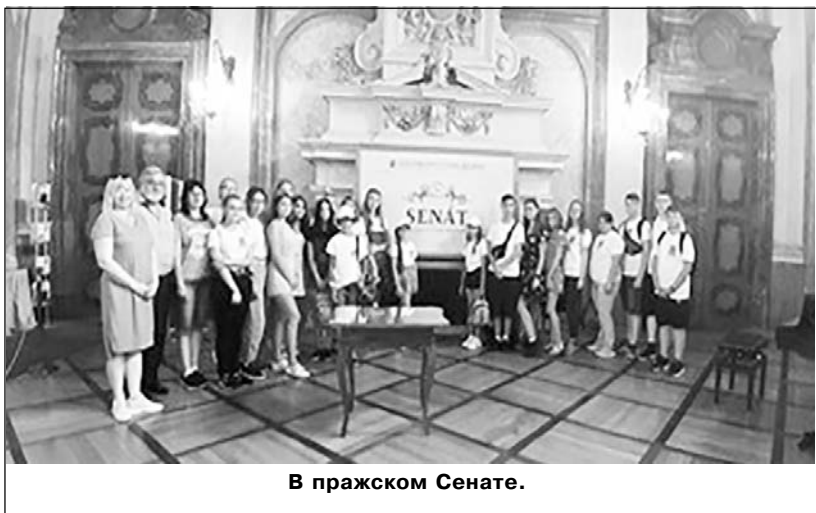
В пражском Сенате.

фортепиано Циммермана. Вот на одном из них, на послевоенном «трофейном» "Циммермане" играла некогда простая московская учительница музыки, которая стала примадонной российской эстрады.