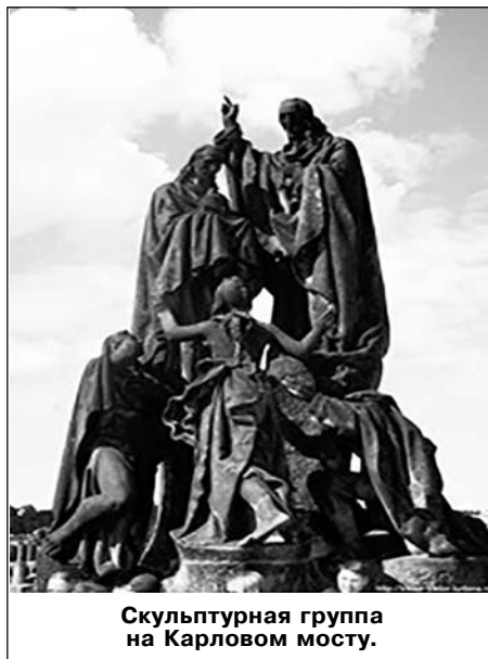
Скульптурная группа на Карловом мосту.

Собираясь в поездку, я, конечно, читала о правилах посещения католи-