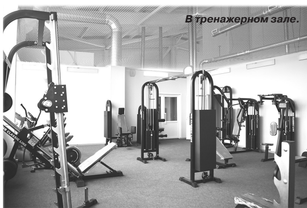
В тренажерном зале.