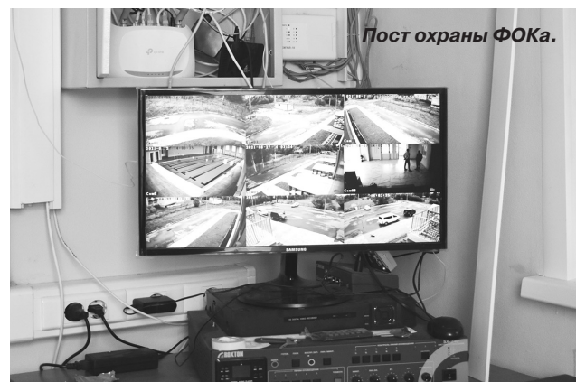
Пост охраны ФОКа.