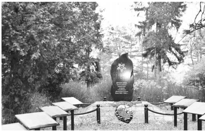
Новый памятник поселянам, погибшим в годы Великой Отечественной войны.