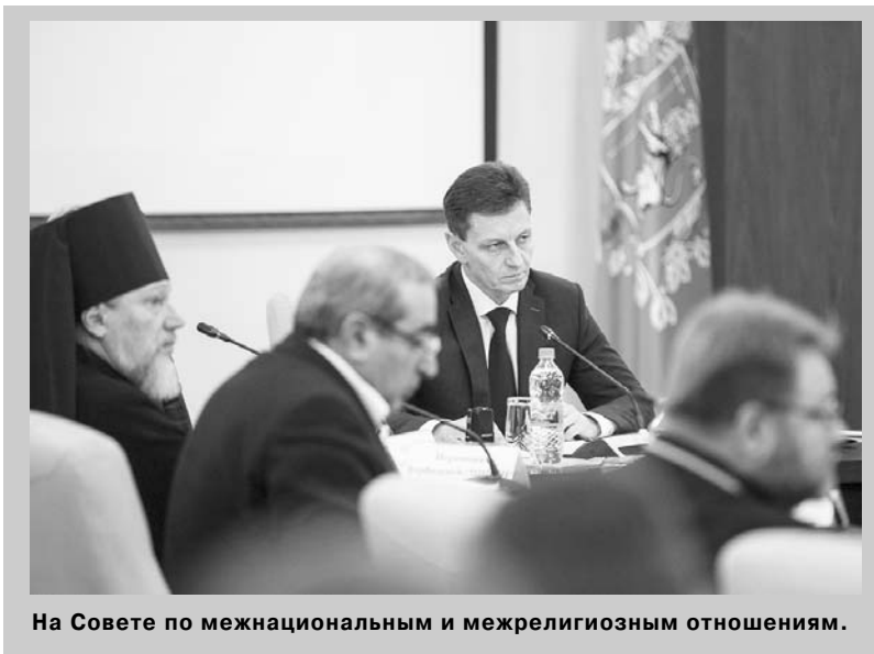
На Совете по межнациональным и межрелигиозным отношениям.

Губернатор Владимир Сипягин обсудил с членами Совета по межнациональным и межрелигиозным отношениям реализацию стратегии государственной национальной политики на территории области.