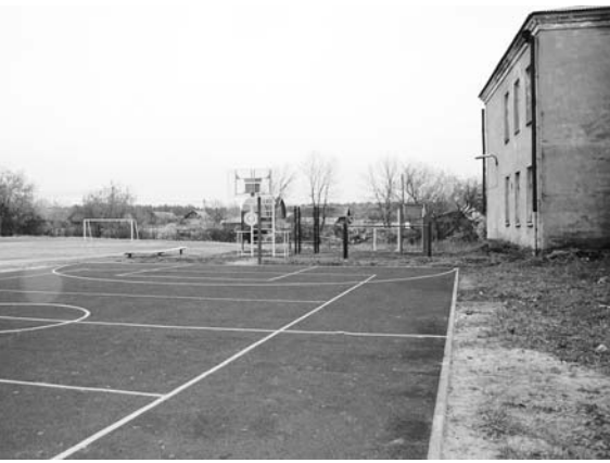
Новая спортивная площадка у Горкинской СШ.