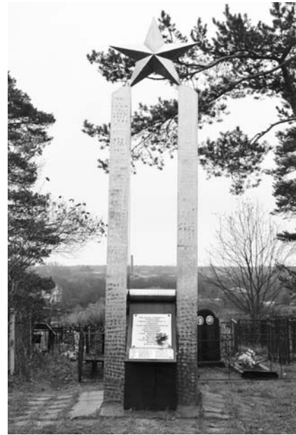
Стела погибшим рабочим кольчугинского завода.