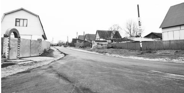
Новая асфальтовая дорога в д. Ельцы.