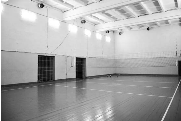
Спортивный зал в ДК Ельцы.

На этом же кладбище имеется еще одно памятное место, посвященное разбившемуся неподалеку экипажу бомбардировщика. Разбился он из-за неисправности, возникшей в ходе полета. Долгое время известно было имя только одного летчика, но благодаря усердным поискам учеников Горкинской школы, все имена и фамилии были восстановлены. Оказалось, что экипаж, состоявший из трех пилотов, был полностью интернациональным. Здесь же захоронены и некоторые уважаемые ветераны ВОВ Горкинского муниципального образования.