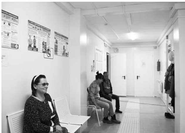
В новом ельцинском ФАПе уже очередь.