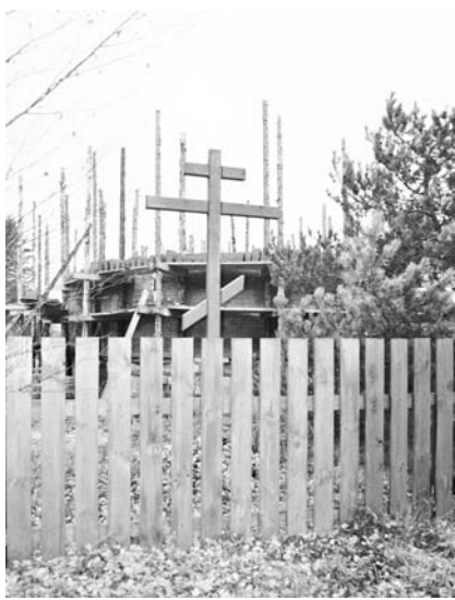
Строящийся храм в д. Илькино.