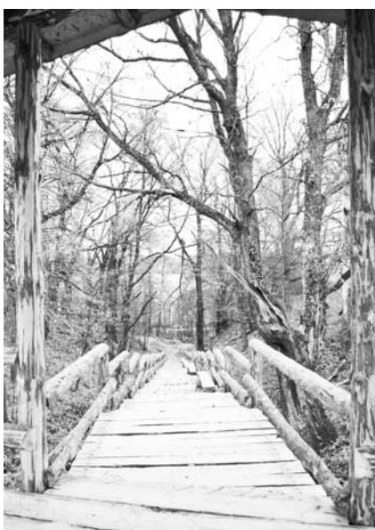
Лестница, ведущая к купальне д. Ельцы.