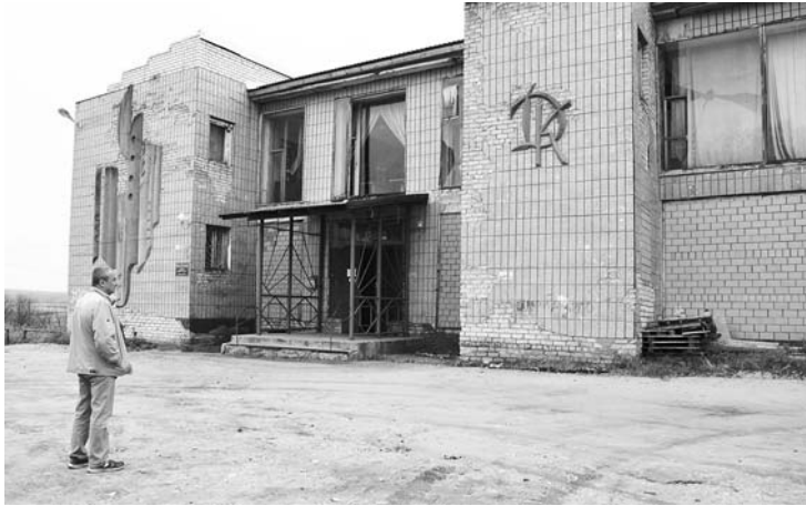
ДК д. Ельцы.