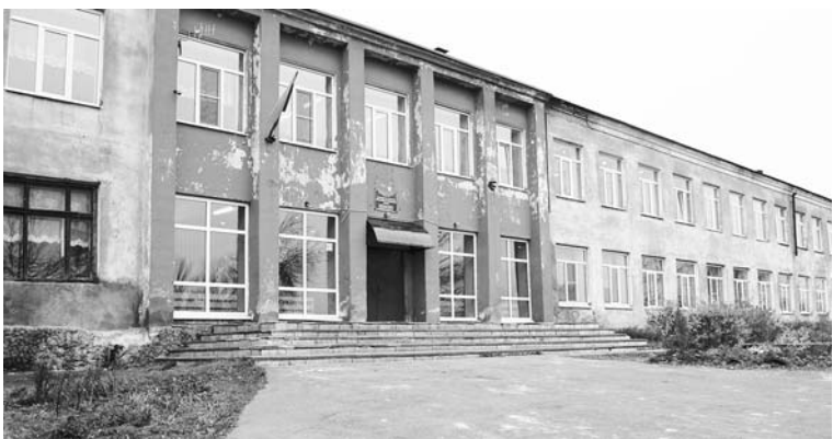
Горкинская школа – фасад здания.