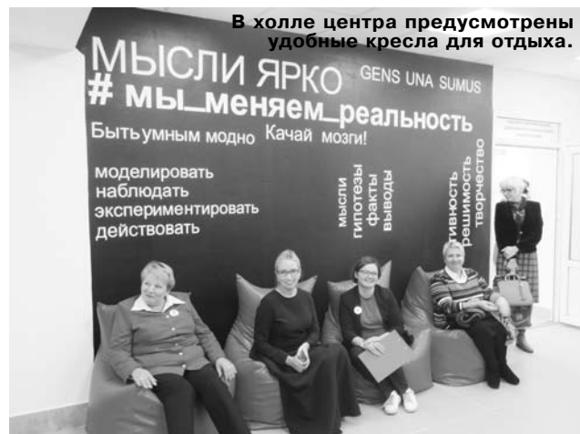
В холле центра предусмотрены удобные кресла для отдыха.