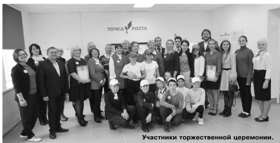
Участники торжественной церемонии.