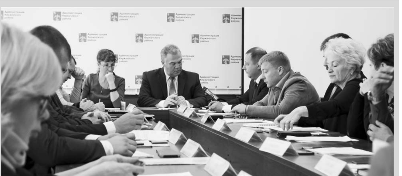
Глава района А. Н. Лукин приступил к своим обязанностям.