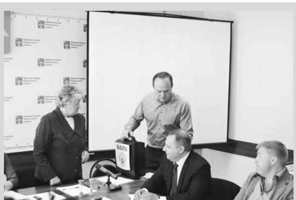
Так выглядит урна для голосования.

Третьим ключевым моментом заседания стали вопросы, связанные с объявлением и организацией конкурса на замещение должности главы администрации Киржачского района.