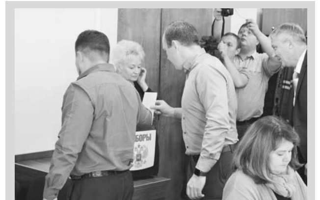
Депутаты выбирают главу Киржачского района.

что Порядок должен соответствовать существующему на данный момент законодательству. Так, в Порядок были внесены поправки по антикоррупционному направлению. О том, что кандидаты, претендующие на эту должность, должны предоставить справки на доходы и имущество на себя, своих супругов и несовершеннолетних детей не только на рассмотрение в конкурсную комиссию, но и на рассмотрение губернатору. Также они должны указывать сведения о сайтах или страницах на сайтах, по которым их можно идентифицировать. Были внесены поправки об индексации заработной платы главы администрации, о ненормированном рабочем дне, об условиях подачи заявок, об извещении участников конкурса и другом. Все поправки, внесенные в Порядок, были одобрены депутатами единогласно.