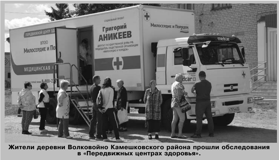
Жители деревни Волковойно Камешковского района прошли обследования в «Передвижных центрах здоровья».

можно по телефону бесплатной «горячей линии» 8-800-2345-003.