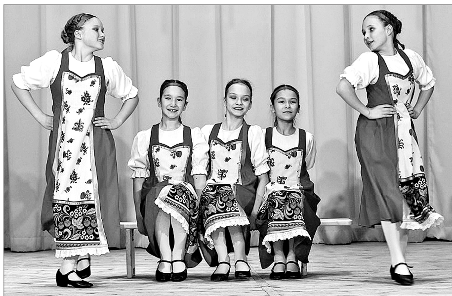
Материалы полосы Людмилы Подройковой.

После концерта мамы и дети с ограниченными возможностями здоровья были приглашены на праздничный фуршет. За чашкой чая они тепло общались с представителями СИБУРа и фонда «Лучик света», которые вручили им цветы и денежные сертификаты. С этого вечера гости уходили с улыбками на лицах, унося с собой массу ярких впечатлений, частичку позитива и хорошего настроения, которые они получили от организаторов благотворительного мероприятия и участников творческой программы.