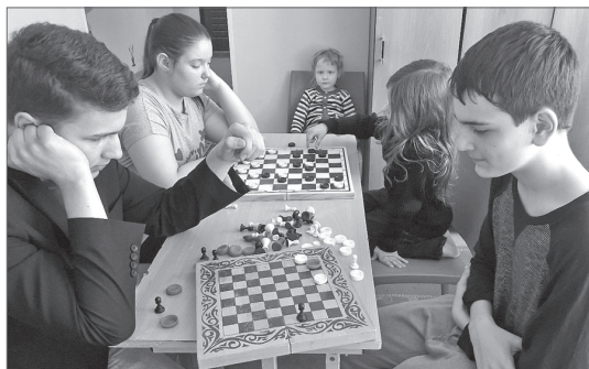
В подростковых клубах каждый ребёнок находит себе развлечение по душе.

Работу с детьми здесь строят по семи направлениям: спорт, культурно-досуговая деятельность, профилактическая деятельность, гражданско-патриотическое воспитание, работа с трудными детьми. А украшение стен - как экспозиция плодов совместного труда: в каждой детали особый смысл, о каждой мелочи есть что вспомнить.