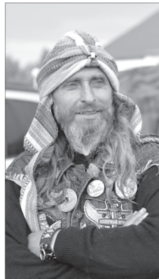
Гости фестиваля видны издали.