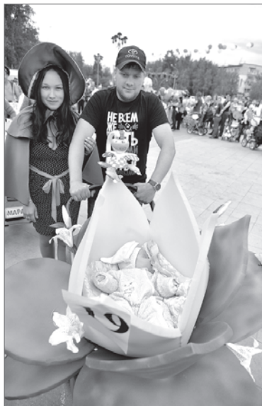
Самая юная Дюймовочка фестиваля.