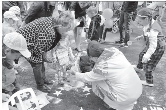
Рисовать на асфальте... мукой учили в парке.