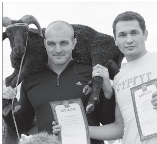
Победитель и призер соревнований по национальной борьбе - куреш.