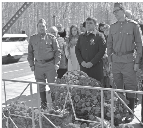
Почести - героям живым. Цветы и вечная память - тем, кто не вернулся с поля боя.

Сколько бы лет ни прошло, время не в силах стереть память о подвиге поколения победителей. Летопись той войны мы собираем по крупицам, а история большой страны становится полнее и ярче, связывая судьбы людей разных времён и поколений. Благодарность можно выражать не только словами. Нефтяники АО «Самолторнефтегаз», дочернего общества НК «Роснефть», ежегодно участвуют в знаковых мероприятиях, приуроченных к Дню Победы, выступают главными помощниками администрации города в организации праздника и чествовании ветеранов Великой Отечественной войны.