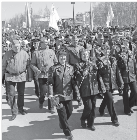
Парадное шествие - это тысячи людей, миллионы судеб и одна на всех Победа.

У каждой страны, у каждого поколения есть праздник, который образует культурную ось народа, объединяя людей разных наций, возрастов, интересов, профессий чувствами гордости, радости, единения. Для России это День Победы. День доблести, не меркнувшей с годами, день памяти о подвиге предков во имя человечества, которую, как генетический код, мы передаём по наследству. Одним из вечных символов этого дня является масштабное шествие, принять участие в котором считает для себя важным каждый россиянин. В Нижневартовске в рядах парада Победы встали тысячи человек. Сказать слова благодарности, поприветствовать героев Великой Отечественной войны вартовчане шли семьями. Живое море заполнило главные городские улицы. Важно, что по волнам памяти вместе с наследниками поколения победителей шли и те, кто отдал жизнь за сохранение мира на Земле.