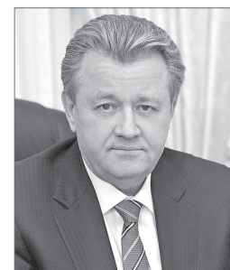
Василий Тихонов, глава Нижневартовска:

– Компания в прошлом году провела модернизацию асфальтобетонных заводов: обновила установки, ёмкости, программное обеспечение заводов. Это позволило производить щебёночно-мастичный асфальт, который отличается высокой прочностью и пригоден для сильно загруженных магистралей. Модернизация проводилась силами самого предприятия, и на это направлено 48 млн рублей.