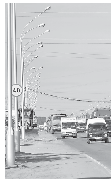
Римма Гайсина.