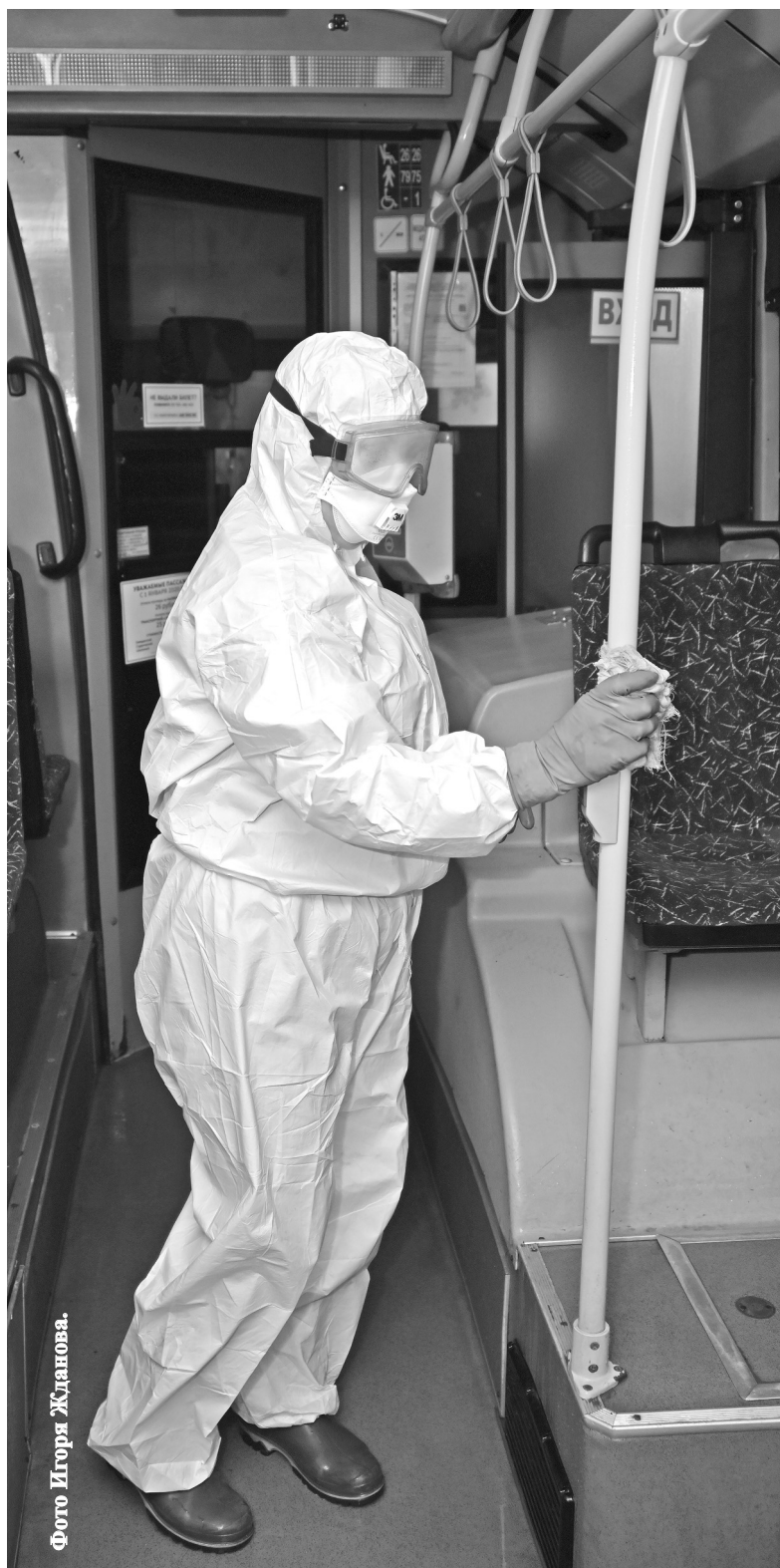
Фото Игоря Жданова.

В Нижневартовске на постоянном контроле обработка транспорта дезинфицирующими средствами.