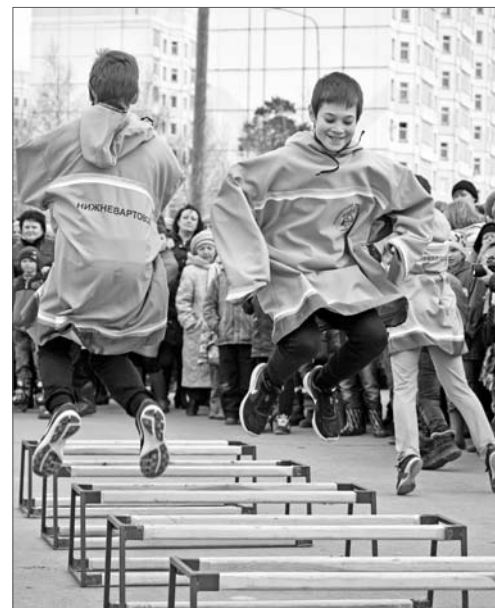
Испытай себя в спортивных состязаниях!