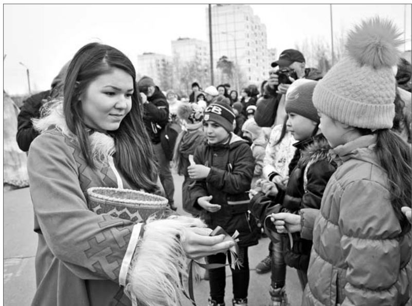
Ленточки повяжем на ветви священного дерева.