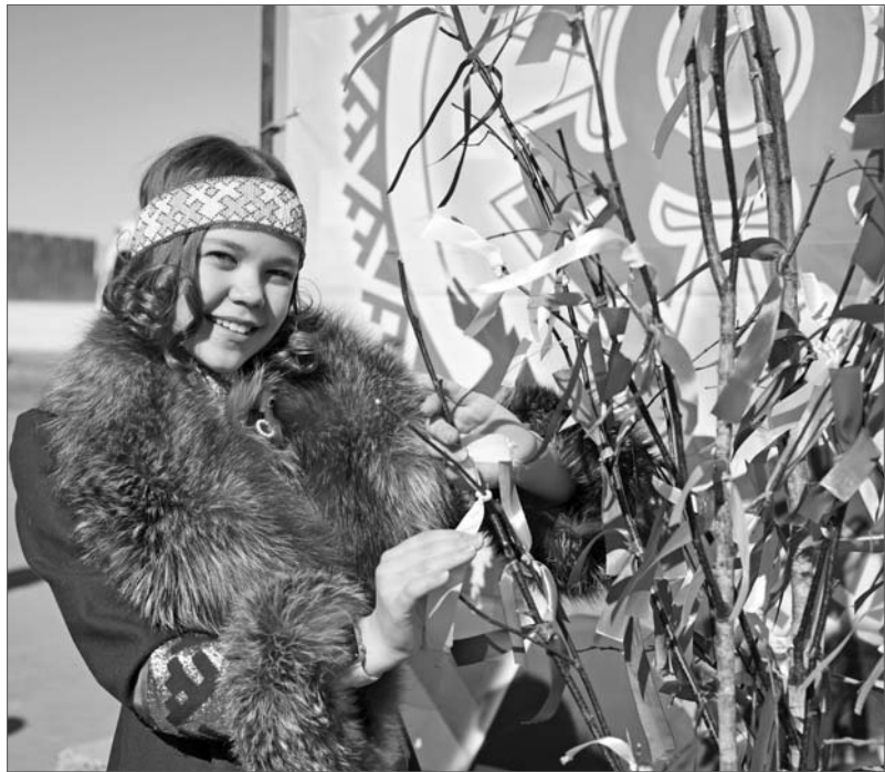
Я своё желание загадала.

Прилетела ворона, и всё, считай, весна пришла, новый календарный год начался! Так полагали в древности обские угры, и многие традиции почитания вороны дошли и до наших дней.