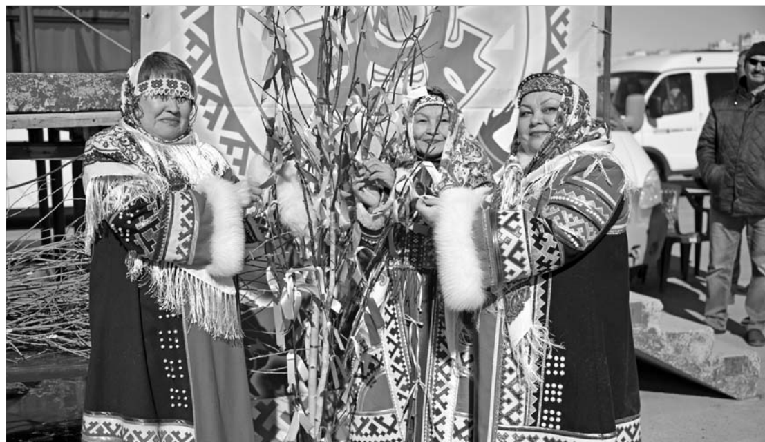
На праздник надеваем всё лучшее!