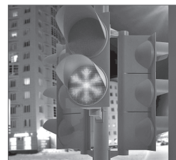
Светофоры на пешеходных переходах, по задумке авторов концепции, украсят различные фигуры и символы.

В ходе разговора участники заседания высказали ещё ряд предложений и замечаний. Авторам было предложено доработать документ с их учётом и представить на следующем заседании градостроительного совета.