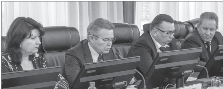
Руководство муниципалитета ставит перед разработчиками цель - создать особый стиль города с помощью освещения.