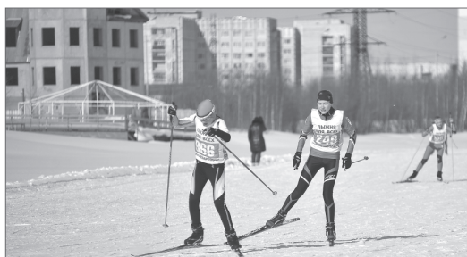
При благоустройстве Комсомольского озера концепцию архитектурно-художественного освещения можно реализовать в полной мере.

планируется благоустроить в этом году, применяя рекомендации концепции архитектурно-художественного освещения.