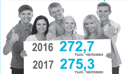
Инфографика Фариды Чешковой.