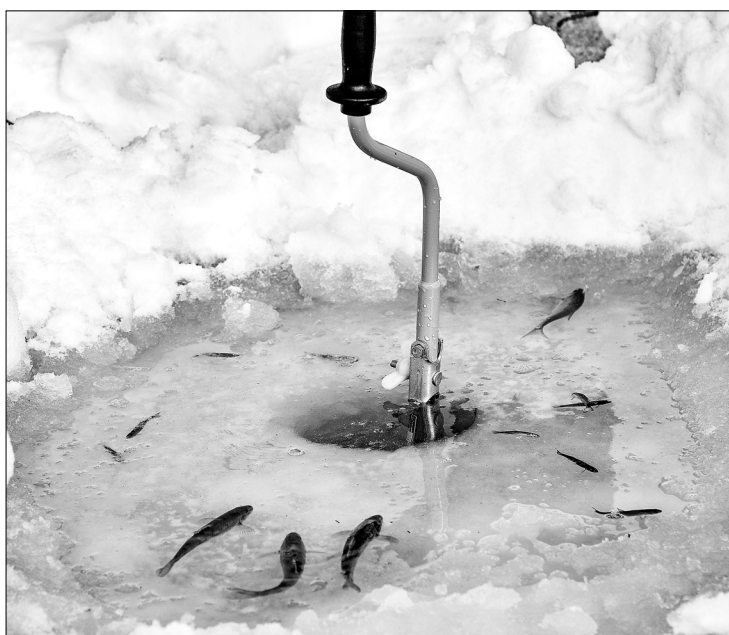
Молодь не только пополнил число обитателей озера, но и послужит им пищей.