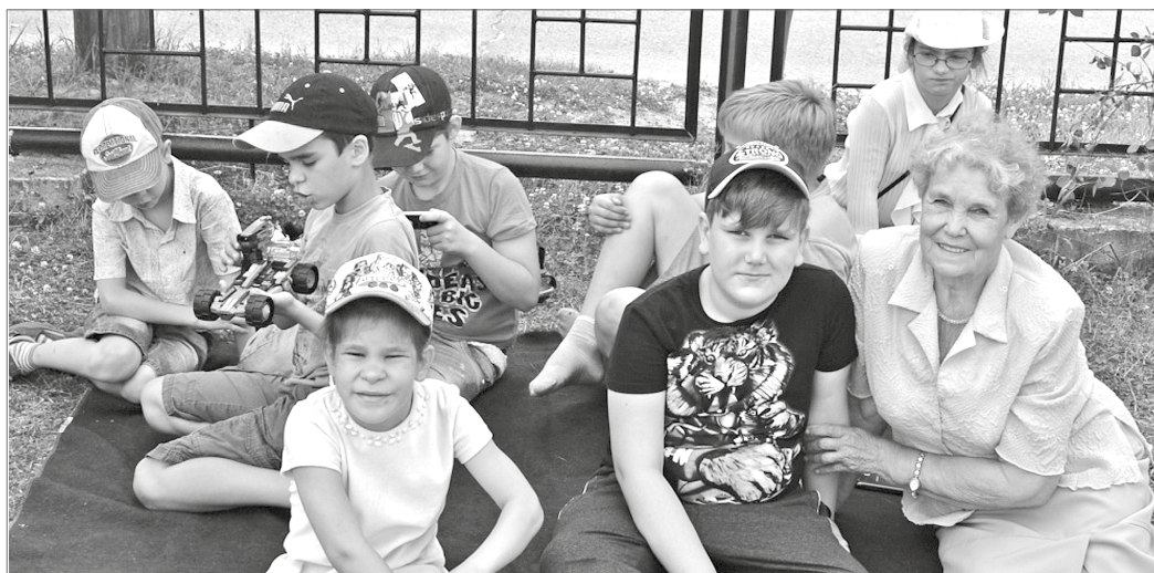
В Нижневартовке реализуется проект «Особенным детям – особенные бабушки».

Более двух тысяч нижевартовцев вовлечены в добровольческое движение. О том, что удалось сделать за минувший год, и о новых проектах шёл разговор на заседании координационного совета по реализации социальной политики в отношении граждан старшего поколения и ветеранов при администрации города.