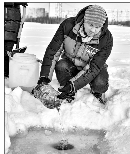
Люди дарят водоёмам долголетие, а его обитателям – жизнь.