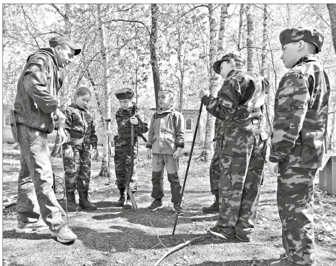
Летний палаточный лагерь Центра детского и юношеского технического творчества «Патриот» на базе «Обь».

За окном ещё снега да вьюга, а в Нижневартовске уже думают об отдыхе юных горожан в летние каникулы. На днях в администрации города состоялось заседание межведомственной комиссии по организации отдыха и занятости детей будущим летом.