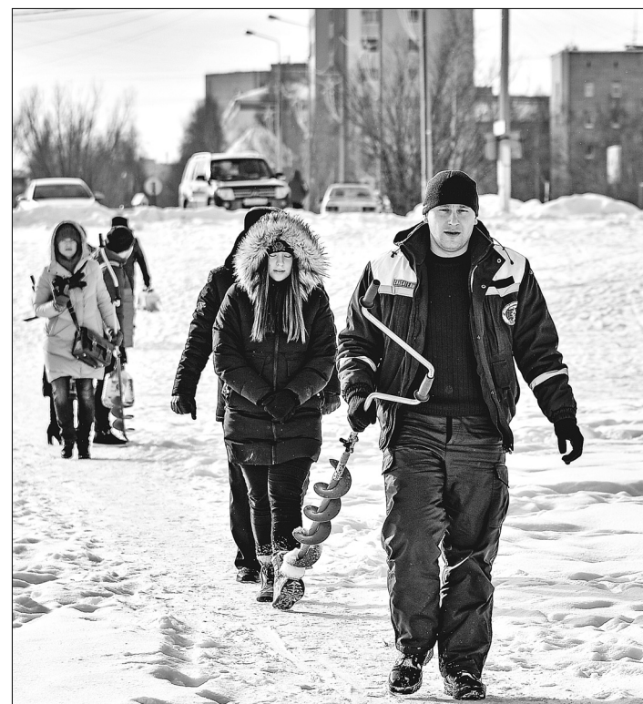
Экологический десант, который помогает предотвратить замор рыбы, работает в разных городах и районах Югры.

В этот день настоящие рыбаки не за уловом к Комсомольскому озеру пришли, а с твёрдым убеждением – помочь его обитателям дышать. Нижневартовск присоединился к региональной акции «Бурим лунки – спасаем рыбу!».