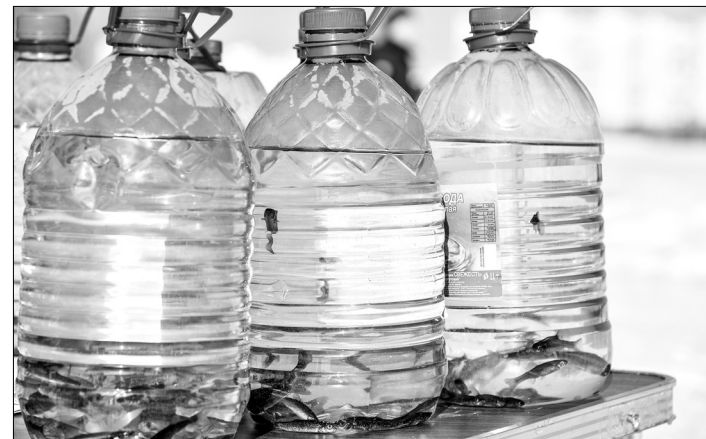
Комсомольское озеро пополнилось новыми обитателями.